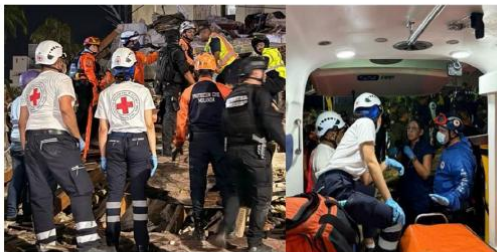
Venezuelan Red Cross staff, together with public authorities, providing urgent assistance to people affected by the earthquake.