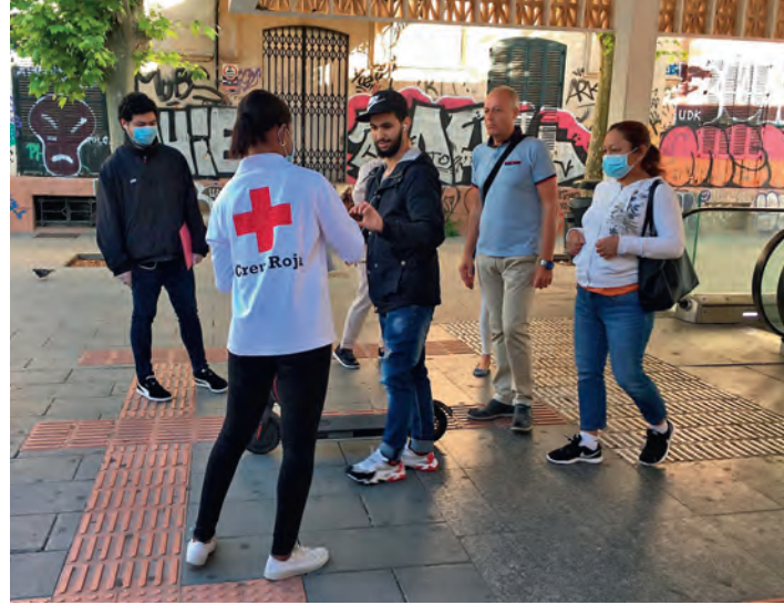
L'ús de màscares en el transport públic segueix sent obligatori.

L'Estació Intermodal i la Plaça d'Espanya a Palma, les estacions de tren d'Inca i Manacor, l'estació d'autobusos CETIS d'Eivissa, la parada d'Isidor Macabich, l'estació d'autobusos de Sant Antoni de Portmany i Santa Eulària i les estacions d'autobusos de