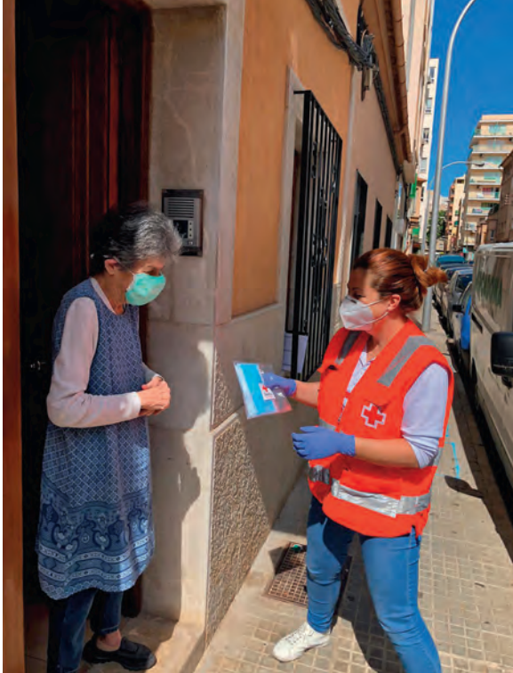
Entrega d'equips d'autoprotecció a domicili.