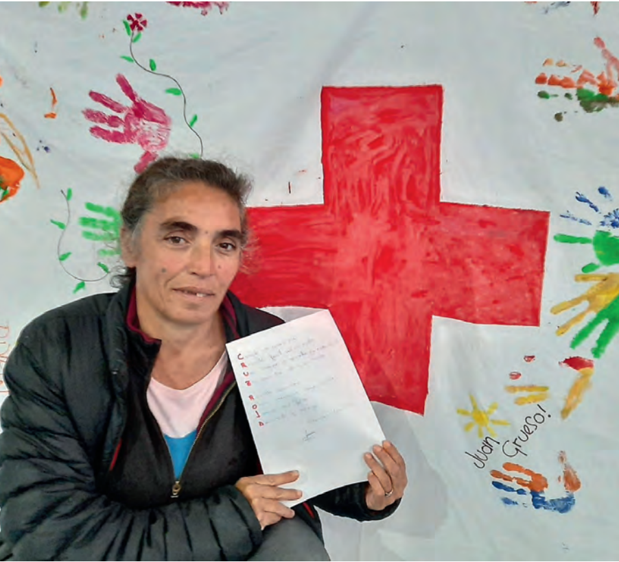
Na Gemma va escriure un poema durant el confinament per agrair la labor de la Creu Roja.