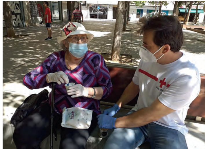
Acompanyam als col·lectius més vulnerables durant l'estat d'alarma.

Maó, Ciutadella, Alaior, Ferreries, Es Mercadal, Sant Lluís i Es Castell, a Menorca han estat els principals punts de repartiment i distribució d'aquest material.