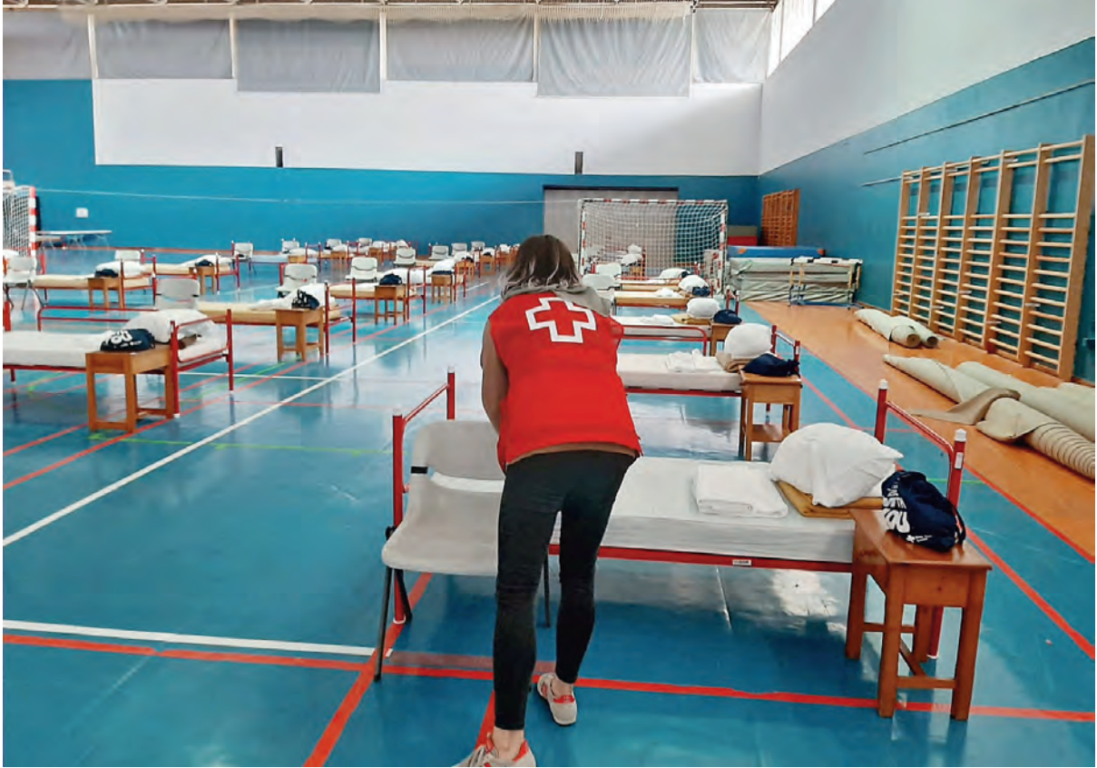
La convivència entre els usuaris, ha estat exemplar.