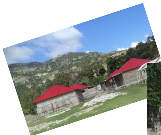
Escuela de Tavette