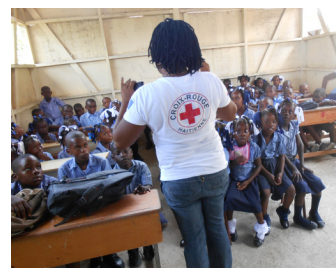
Sensibilización en escuelas

En número de beneficiarios directos estimado para este proyecto es de casi 20.000 personas, de las cuales el 50% son mujeres y el 40% son menores de 18 años.