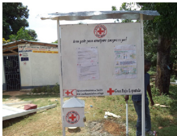
Panel informativo con cajetín de sugerencias en Léogâne

A día de hoy, la rendición de cuentas se ha integrado en todos los proyectos llevados a cabo en Haití (en el Proyecto Cólera , por ejemplo) y se ha convertido en un referente dentro de Cruz Roja Española para aplicar en otros contextos.