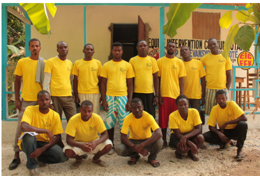
EIC de Jean Jean en Oranger. Léogâne

Estos centros, promueven un servicio esencial en estas comunidades tan vulnerables, reforzando la instalación de los sistemas de alerta temprana, ejercicios de simulación ante desastres , capacitación en construcción segura y protección de cultivos .