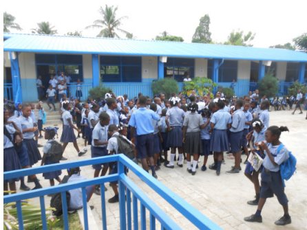
Simulacro de desastre. Deslandes