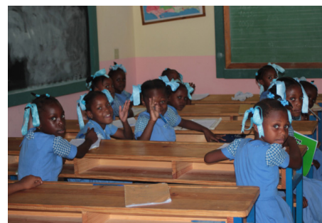
Aula de Sainte Rose de Lime