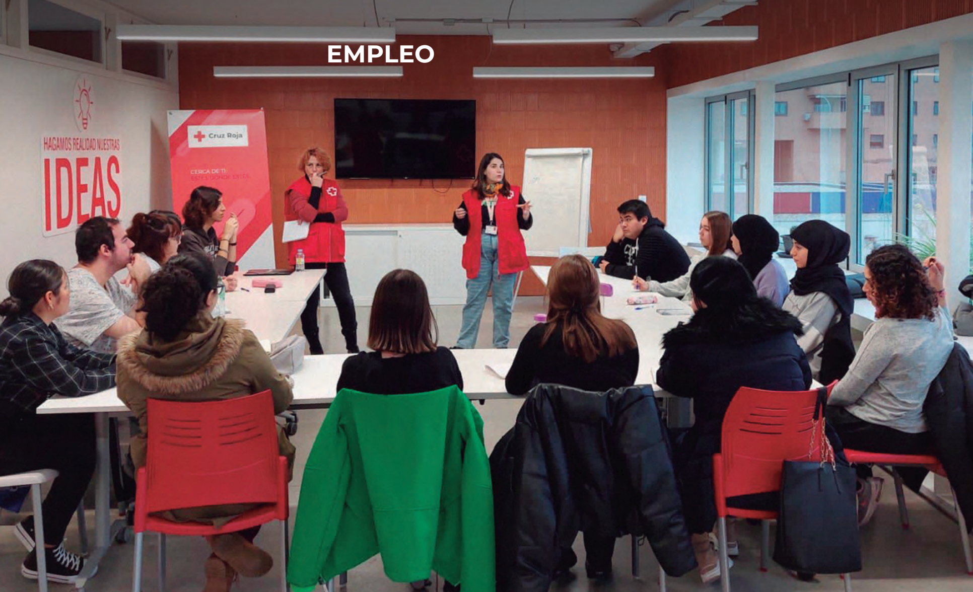
TándEM se lleva a cabo en 12 provincias con varios proyectos destinados a jóvenes de 16 a 29 años.