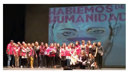
Los técnicos y voluntariado del proyecto de mujer de Cruz Roja Ceuta recogen la distinción recibida por FAJC.