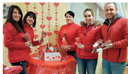
▶ En uno de los colegios que colaboró con la campaña.