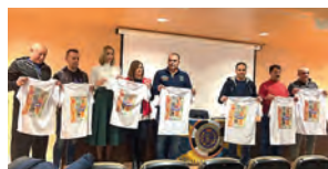
Presentación del VI Torneo CD Polillas 'Un juguete, una sonrisa'.

numerosas empresas, instituciones y particulares participaron en esta campaña. Además de la entrega de juguetes, Almacenes San Pablo impulsó una nueva iniciativa, 'Juguetes Solidarios', en la que destinó el 20% del importe de determinados productos a proyectos sociales de la Institución. Por su parte, el CD Polillas también colaboró con la entrega de juguetes aportados por el público que acudió al torneo benéfico de Navidad. Este año también se unió a la campaña el CEIP Beatriz de Silva.