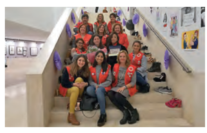
Tras recoger la mención, el equipo posa en las escaleras donde además, había una exposición en la que se podían apreciar zapatos vacíos, un símbolo en recuerdo de las mujeres que ya no pueden estar con nosotros.