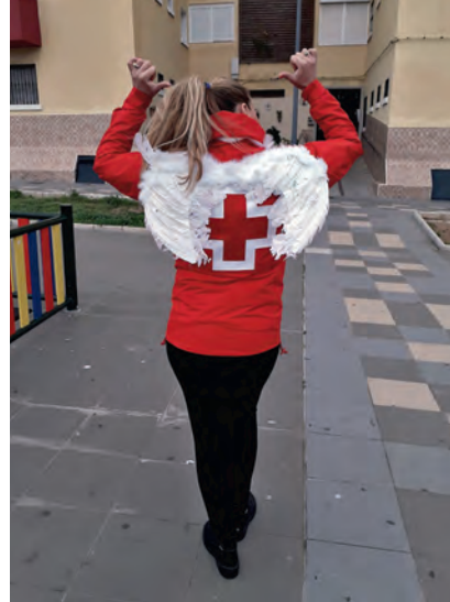
▶ Una ‘Cupido Voluntaria’ antes de hacer una entrega en un domicilio.