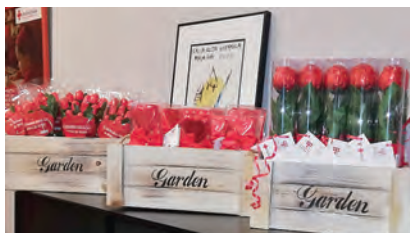
▶ Así salieron a la venta las rosas, ramos y piruletas de chocolate en forma de corazón que se distribuyeron por las calles de Ceuta.