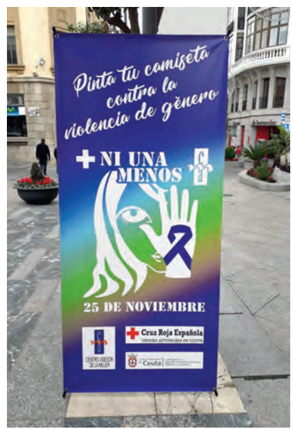
Cartel que ilustraba la actividad que se desarrolló toda la semana del 25N para conmemorar el Día Mundial contra la Violencia de Género. En un estand situado en la principal vía de la ciudad, todos aquellos ciudadanos que quisieron pudieron pintar su propia camiseta. Esa prenda se lució el 25N en la concentración que convocó la ciudad autónoma.