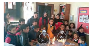
Parte del voluntariado y de los pequeños que participaron en la fiesta de Halloween.

menores que participan en este proyecto reciben apoyo escolar por parte de nuestro voluntariado y meriendas saludables. Gracias al convenio con la Fundación Real Madrid, también se celebra la escuela de fútbol, a la que acuden 20 niños y 63 voluntarios y voluntarias.