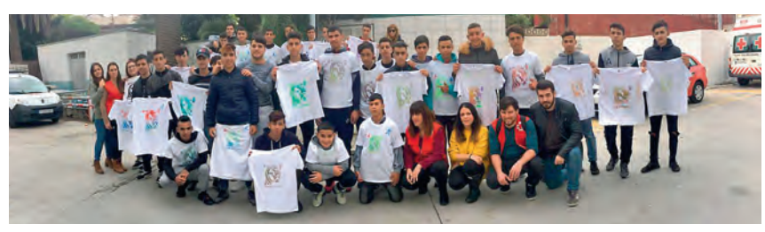
Los chicos de DIGMUN también vinieron a colaborar con su propio diseño de camiseta.