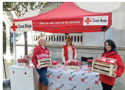
▶ Voluntarias en el punto de venta de Paseo de Revellín durante los días previos a San Valentín.