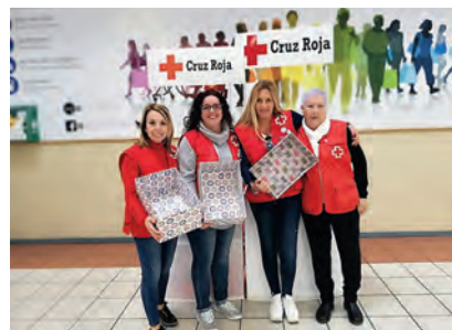
▶ Momento en el que se dio por finalizada la venta, ya que se agotaron todas las existencias.

COMITÉ DE CRUZ ROJA EN LA CIUDAD AUTÓNOMA DE CEUTA: C/ MARINA ESPAÑOLA, 24. 51001 CEUTA. TEL. 956 52 50 00. FAX 956 51 62 57. E-MAIL: CEUTA@CRUZROJA.ES. COORDINACIÓN Y REDACCIÓN: DEPARTAMENTO DE COMUNICACIÓN. EDITA: CRUZ ROJA ESPAÑOLA. DIRECCIÓN DE LA REVISTA: DEPARTAMENTO DE COMUNICACIÓN DE CRUZ ROJA.