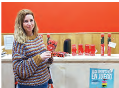
▶ Nuestra primera clienta recogió sus encargos en la oficina territorial.

La recaudación de esta campaña irá dirigida a todos los proyectos de mujer e infancia de Cruz Roja Ceuta.