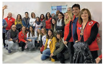
Foto de familia del equipo que trabaja en INTEGRALIA y que acudió al Ayuntamiento de Ceuta, donde ellos mismos llevaron a cabo una teatralización de diversas escenas de micromachismos.