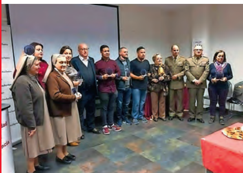
▶ Acto de reconocimiento a los voluntarios.

En el Día Internacional del Voluntariado, Cruz Roja reconoció la labor de todas aquellas personas e instituciones que de forma altruista trabajan por y para los más necesitados.