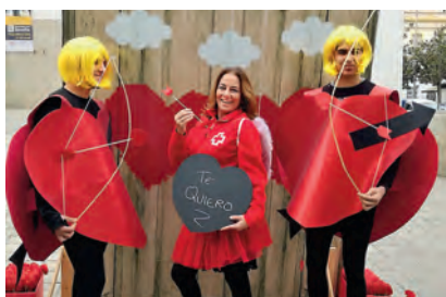
▶ Nuestros ‘Cupidos voluntarios’ en la calle, el día de San Valentín.