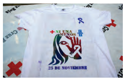
Imagen de la camiseta, que bajo el lema 'Ni una menos', se creó para esta conmemoración.

A lgunas imágenes de todas las actividades que, con motivo del Día Internacional contra la Violencia de Género, ha llevado a cabo el proyecto INTEGRALIA de Cruz Roja Ceuta. La FAJC (Federación de Asociaciones Juveniles de Ceuta) ha galardonado esta iniciativa por su labor y lucha diaria contra la violencia de género.