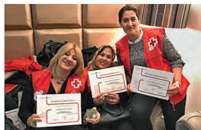
Algunas voluntarias de personas mayores con sus diplomas de reconocimiento.

Cruz Roja en Ceuta se encuentra inmersa en la campaña 'Mil Maneras de Voluntariado', para demostrar que hacer voluntariado en la Institución es fácil, ágil y flexible. La campaña ha logrado gran afluencia de voluntarios y voluntarias en la ciudad.