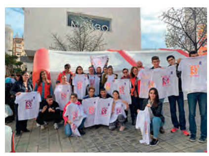
El CEE San Antonio visitó nuestro estand, donde realizó su propia camiseta para el 25N.