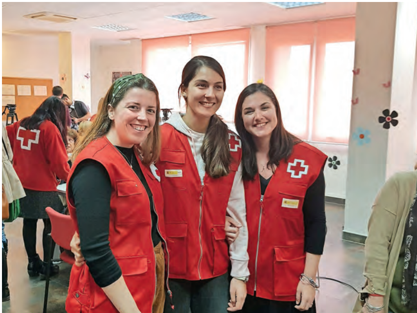
▶ Técnicas del 'Programa Enrédate'.