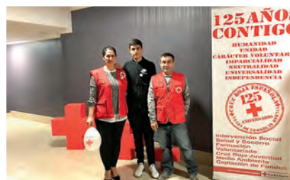
Voluntariado de Transporte Adaptado que acudió a la celebración.

El CD Polillas, el Campus Universitario, Almacenes San Pablo y otras muchas personas e instituciones han colaborado en la iniciativa