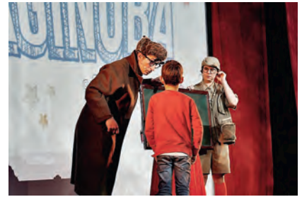
► Reconocimiento a los socios y socias más pequeños.

tes actos de agradecimiento a los socios y socias. Un ejemplo fue el acto de reconocimiento que la Asamblea local de Madrid organizó en CaixaForum, donde reunió a más de 150 personas. También hubo espacio para poder agradecer la labor de los socios y socias más pequeños a través de la representación de una divertida obra de teatro infantil, desarrollada en el Teatro La Latina y a la que acudieron alrededor de 300 pequeños y pequeñas.