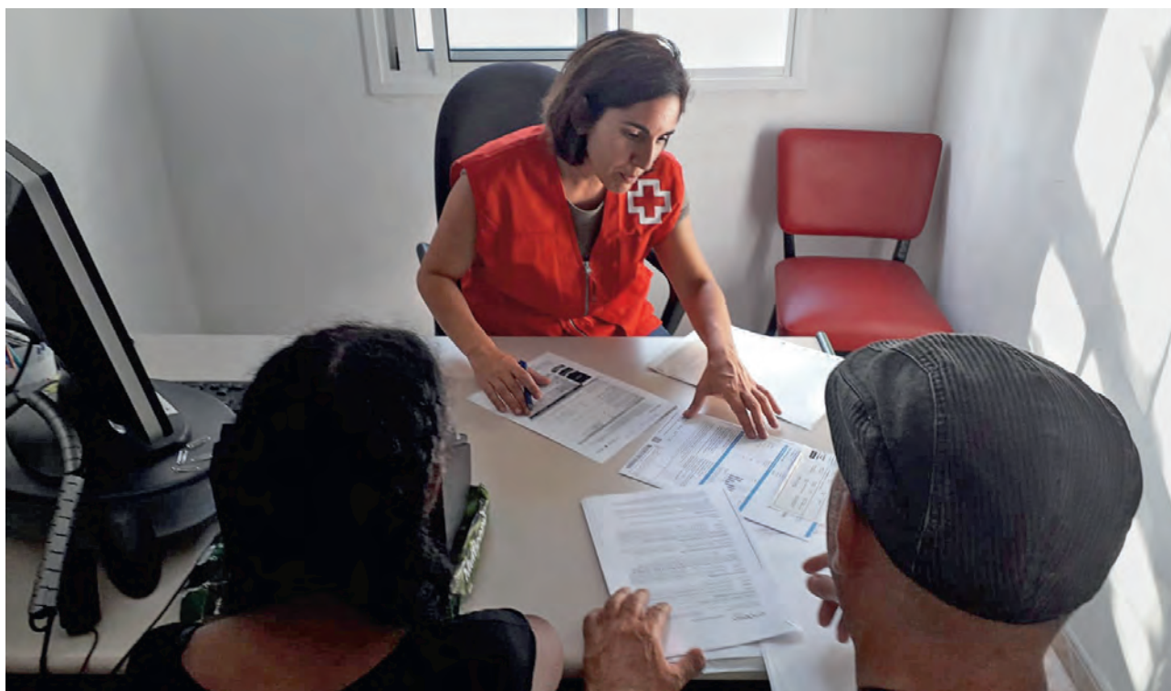
► Dos personas cumplimentan un bono social.