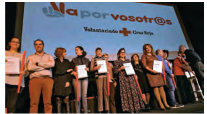
► Momento del acto de reconocimiento a las personas voluntarias.