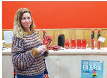
▶ Nuestra primera cliente recogió sus encargos en la oficina territorial.

La recaudación de esta campaña irá dirigida a todos los proyectos de mujer e infancia de Cruz Roja Ceuta.