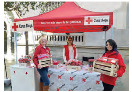
▶ Voluntarias en el punto de venta de Paseo de Revellín durante los días previos a San Valentín.