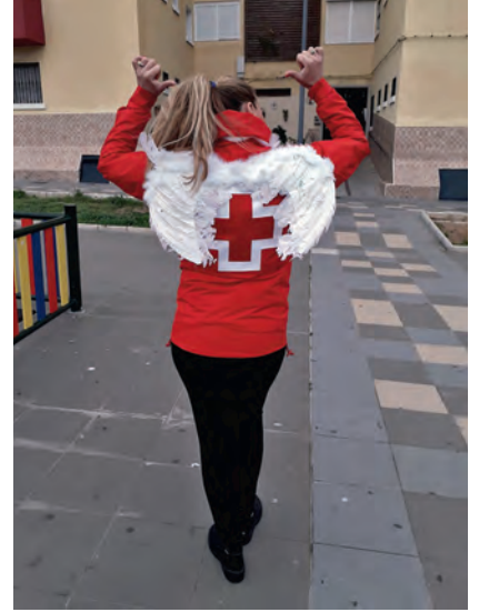
▶ Una ‘Cupido Voluntaria’ antes de hacer una entrega en un domicilio.