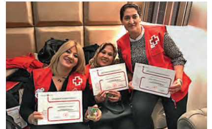
Algunas voluntarias de personas mayores con sus diplomas de reconocimiento.

Cruz Roja en Ceuta se encuentra inmersa en la campaña 'Mil Maneras de Voluntariado', para demostrar que hacer voluntariado en la Institución es fácil, ágil y flexible. La campaña ha logrado gran afluencia de voluntarios y voluntarias en la ciudad.