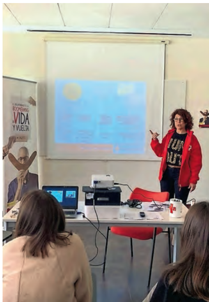
▶ Sesión de formación.