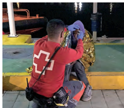
▶ ERIE atendiendo a una persona migrante.

Las personas mayores son, con más de mil beneficiarios, las que reciben un mayor número de atenciones por parte del personal y el voluntariado de Cruz Roja en Melilla. Mediante el Servicio de Teleasistencia Domiciliaria , los mayores de la ciudad perciben la sensación de seguridad de tener a siempre a alguien al otro lado del teléfono para cualquier incidencia de salud, de soledad o simplemente para conversar.