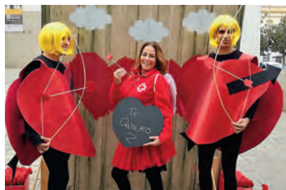
▶ Nuestros ‘Cupidos voluntarios’ en la calle, el día de San Valentín.