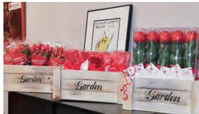
▶ Así salieron a la venta las rosas, ramos y piruletas de chocolate en forma de corazón que se distribuyeron por las calles de Ceuta.