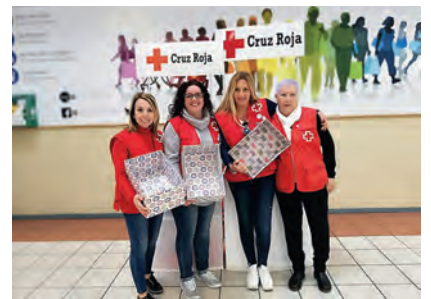
▶ Momento en el que se dio por finalizada la venta, ya que se agotaron todas las existencias.

COMITÉ DE CRUZ ROJA EN LA CIUDAD AUTÓNOMA DE CEUTA: C/ MARINA ESPAÑOLA, 24. 51001 CEUTA. TEL. 956 52 50 00. FAX 956 51 62 57. E-MAIL: CEUTA@CRUZROJA.ES. COORDINACIÓN Y REDACCIÓN: DEPARTAMENTO DE COMUNICACIÓN. EDITA: CRUZ ROJA ESPAÑOLA. DIRECCIÓN DE LA REVISTA: DEPARTAMENTO DE COMUNICACIÓN DE CRUZ ROJA.