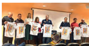
Presentación del VI Torneo CD Polillas 'Un juguete, una sonrisa'.

numerosas empresas, instituciones y particulares participaron en esta campaña. Además de la entrega de juguetes, Almacenes San Pablo impulsó una nueva iniciativa, 'Juguetes Solidarios', en la que destinó el 20% del importe de determinados productos a proyectos sociales de la Institución. Por su parte, el CD Polillas también colaboró con la entrega de juguetes aportados por el público que acudió al torneo benéfico de Navidad. Este año también se unió a la campaña el CEIP Beatriz de Silva.