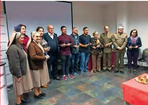
▶ Acto de reconocimiento a los voluntarios.

En el Día Internacional del Voluntariado, Cruz Roja reconoció la labor de todas aquellas personas e instituciones que de forma altruista trabajan por y para los más necesitados.