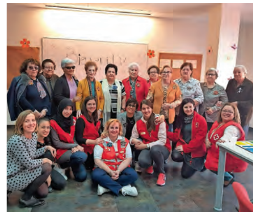
▶ Dedicar tiempo a los mayores es fundamental.

Las actividades se llevan a cabo tanto en las instalaciones de nuestra Asamblea como en las de Aulas Culturales para Mayores, donde las personas participan activamente tanto en un taller de bachata como en charlas para el manejo de las