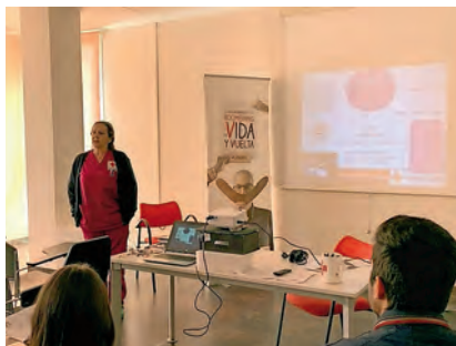
▶ Charla de formación.