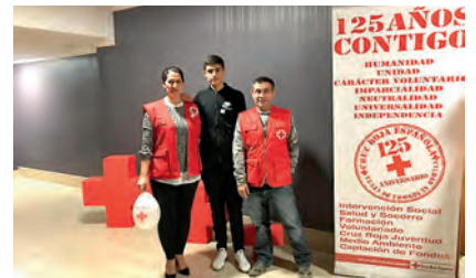
Voluntariado de Transporte Adaptado que acudió a la celebración.

El CD Polillas, el Campus Universitario, Almacenes San Pablo y otras muchas personas e instituciones han colaborado en la iniciativa