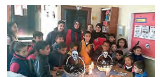
Parte del voluntariado y de los pequeños que participaron en la fiesta de Halloween.

menores que participan en este proyecto reciben apoyo escolar por parte de nuestro voluntariado y meriendas saludables. Gracias al convenio con la Fundación Real Madrid, también se celebra la escuela de fútbol, a la que acuden 20 niños y 63 voluntarios y voluntarias.