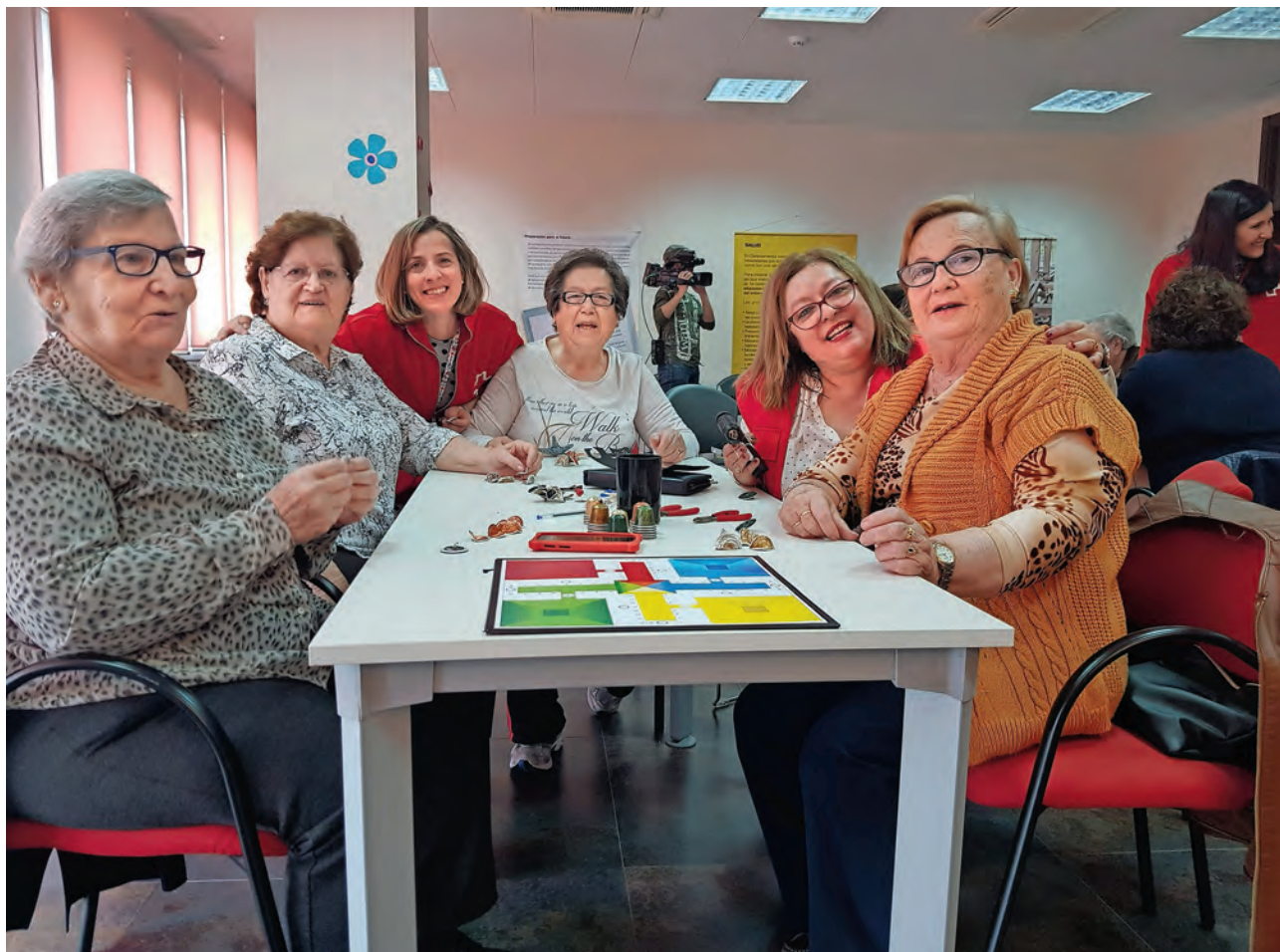
▶ Taller de manualidades.