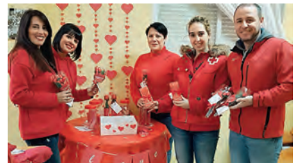
▶ En uno de los colegios que colaboró con la campaña.