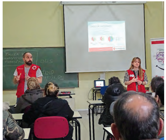
► Taller de eficiencia energética.

Fue sin duda, una cita muy especial, muy emotiva y organizada con mucho cariño para los que son el corazón y el motor de Cruz Roja Española, los voluntarios. Gracias a ellos, podemos ayudar a cerca de 50.000 personas cada año en Cantabria.