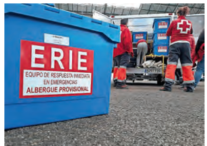
ERIE Albergue provisional.

personas entre psicólogos, trabajadores sociales y socorristas de acompañamiento psicológico.