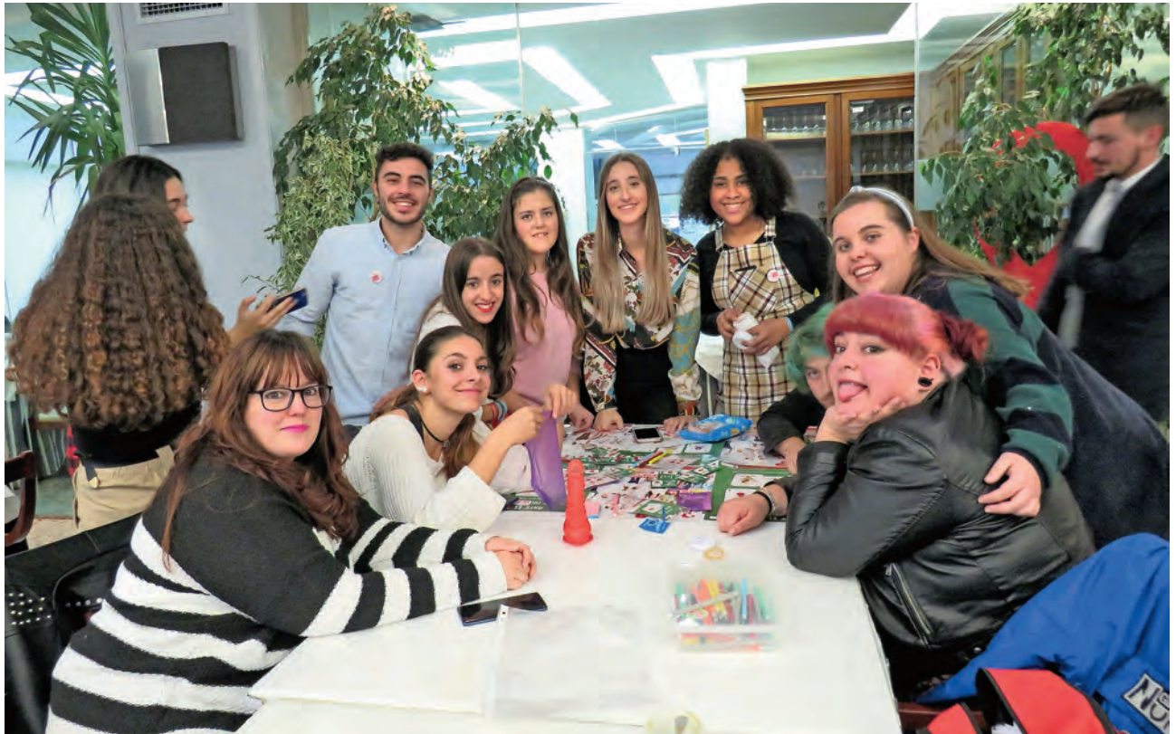
▶ Voluntariado de Cruz Roja Juventud.

sonas no deseables (pederastas o acosadoras), exposición de contenidos nocivos (pornografía, pornografía infantil, drogas, contenidos racistas, xenófobos...), fraudes económicos o legales, o abuso del tiempo de exposición a Internet.