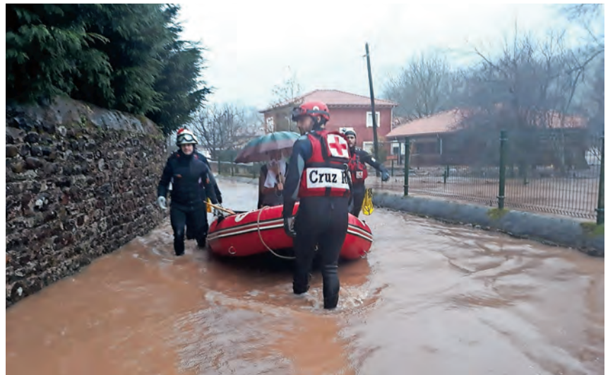
Intervención en las inundaciones de enero.