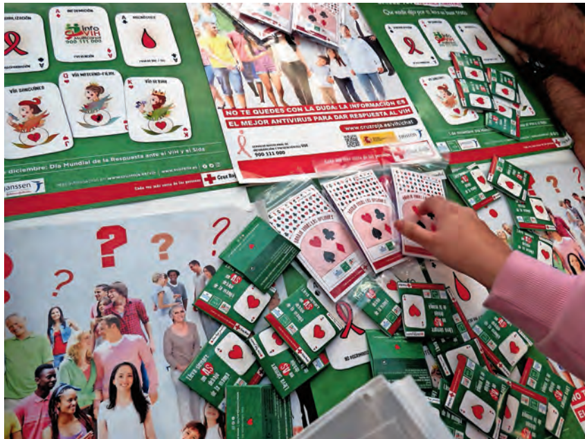
► Cartel por el Día Mundial contra el Sida.