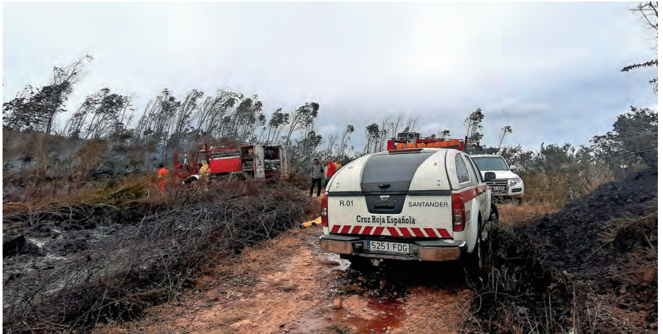
▶ Apoyo del Equipo de Logística en los incendios del pasado mes de marzo.