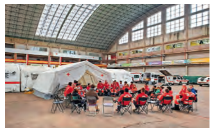
Jornada de formación de ERIES.

ERIE de intervención psicosocial: proporciona una adecuada atención a las víctimas, familiares y allegados que se vean afectados por una situación de emergencia, con la finalidad de satisfacer las necesidades psicológicas, sociales e incluso, sanitarias que puedan tener los afectados, en estos primeros momentos de la emergencia. Intentos de suicidio, búsqueda y salvamento de víctimas, accidentes de tráfico, acciones terroristas o desastres naturales, entre otros, son las principales atenciones que realiza este equipo compuesto por 31