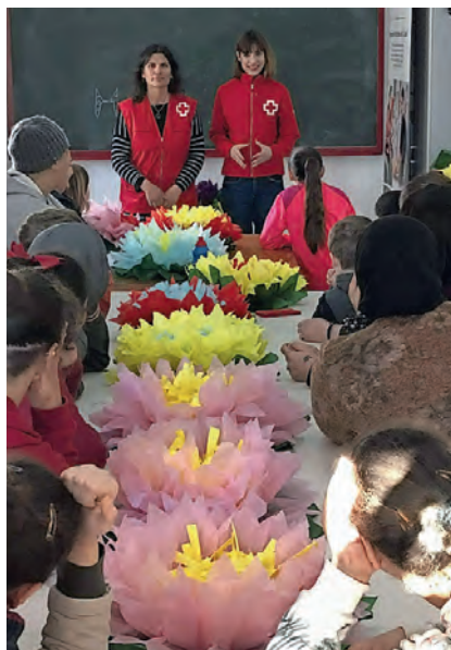
▶ Padres, madres, niños y niñas comparten actividades con el voluntariado.

Cruz Roja crea espacios donde padres, madres y sus hijos e hijas refuerzan los vínculos familiares a través de juegos y talleres. De esta manera, con mucha diversión, mejoran las habilidades para la crianza y la educación de los pequeños.