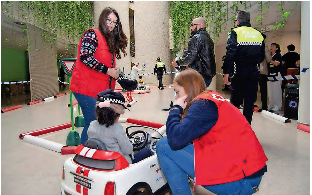
► Presentación del vehículo teledirigido en el Hospital Juan Ramón Jiménez, de Huelva.