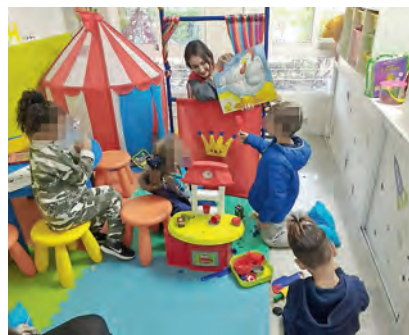
▶ El espacio infantil cuenta con juguetes y material para dibujar.

La iniciativa, financiada con fondos de la casilla de Fines Sociales del Impuesto de la Renta (IRPF), ha sido pionera en Andalucía. Desde que se impulsó hace dos años, han pasado por la ludoteca más de 220 niños y niñas, y han participado una veintena de personas voluntarias, todas