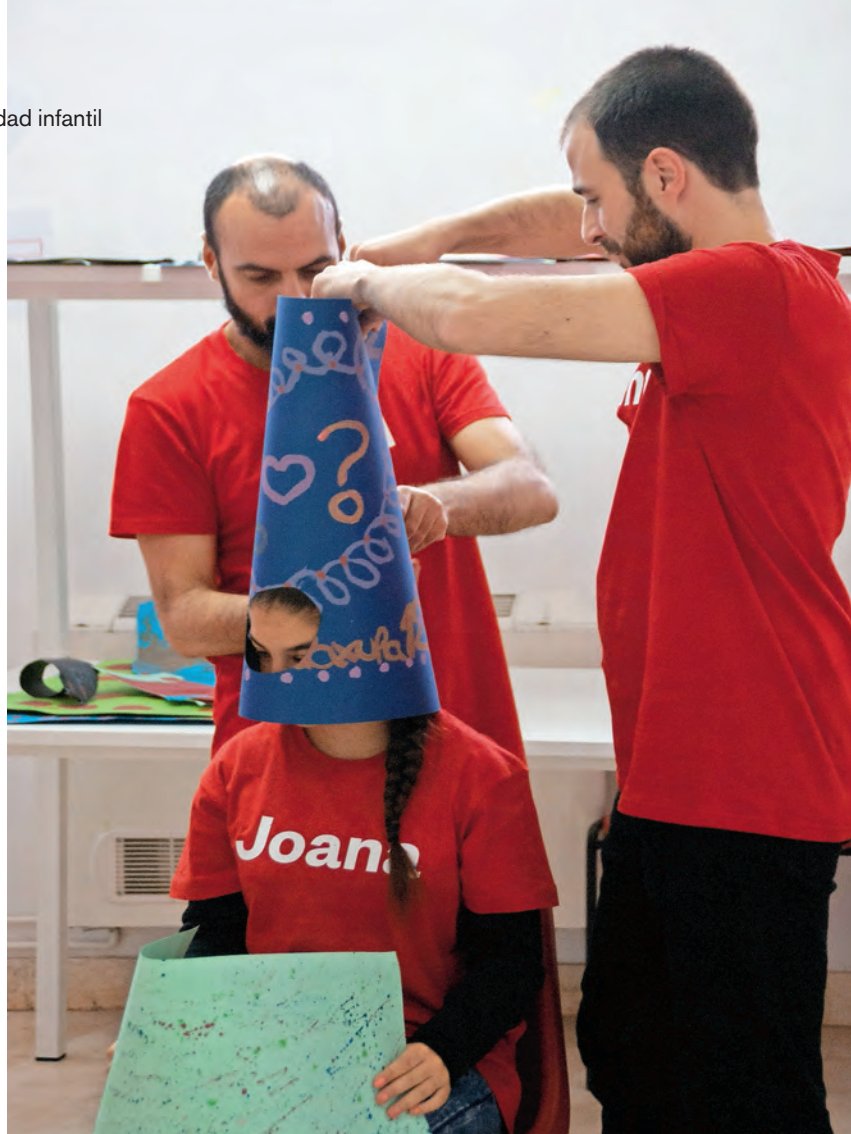
▶ La iniciativa se desarrolló en el centro El Pinar de Cruz Roja en Loja.

La Creatividad al Principio cumple ya dos ediciones en Loja con el apoyo del Grupo de Restauración Abades, que ha financiado los materiales y recursos utilizados en los talleres, así como la grabación y producción del documental. La primera edición también contó con la colaboración soli-