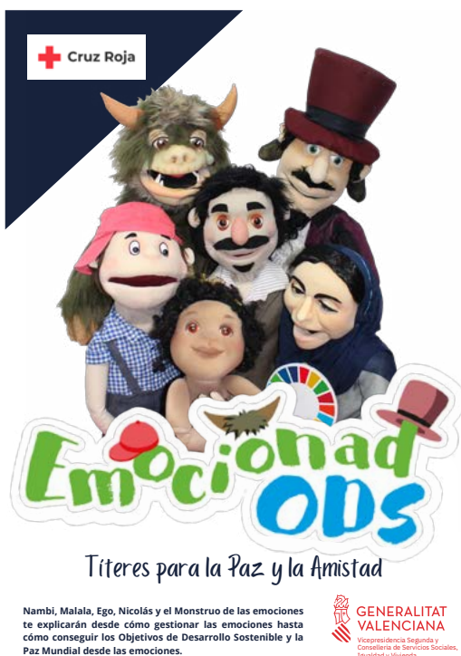
Cartel EmocionadODS_Títeres para la Paz y la Amistad

Las acciones de Educación para la ciudadanía global impulsadas desde Cooperación Internacional se enmarcan y alinean con el resto de actividades de la organización con el entorno; dichas acciones incorporan el criterio de actuación de Participación con el objetivo de mejorar la implicación y contribución de las personas en la construcción de una nueva ciudadanía más activa y en compromiso constante, favoreciendo sus propias iniciativas. Estas acciones se enmarcan en los nuevos escenarios de participación y colaboración impulsados por la organización con el objeto de intensificar nuestro ideario humanitario.