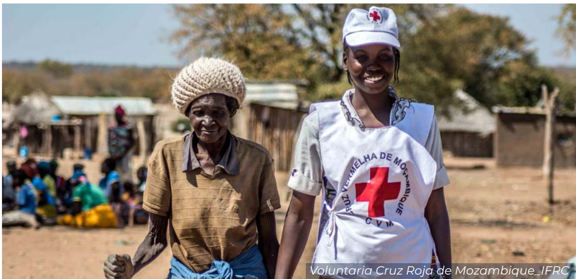
Voluntaria Cruz Roja de Mozambique_IFRC

Asímismo, apoyamos a las Sociedades Nacionales en la elaboración y desarrollo de sus políticas y procedimientos de protección y salvaguarda.