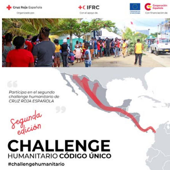
Cartel 2ª Edición del Challenge Humanitario

El desarrollo de soluciones innovadoras tanto en el ámbito social como tecnológico se articula en base a necesidades identificadas e incluye el pilotaje, escalado y promoción de las soluciones innovadoras. Apoyamos la innovación a través del intercambio de buenas prácticas, metodologías y soluciones y resultados, así como a través de la transferencia de conocimiento.