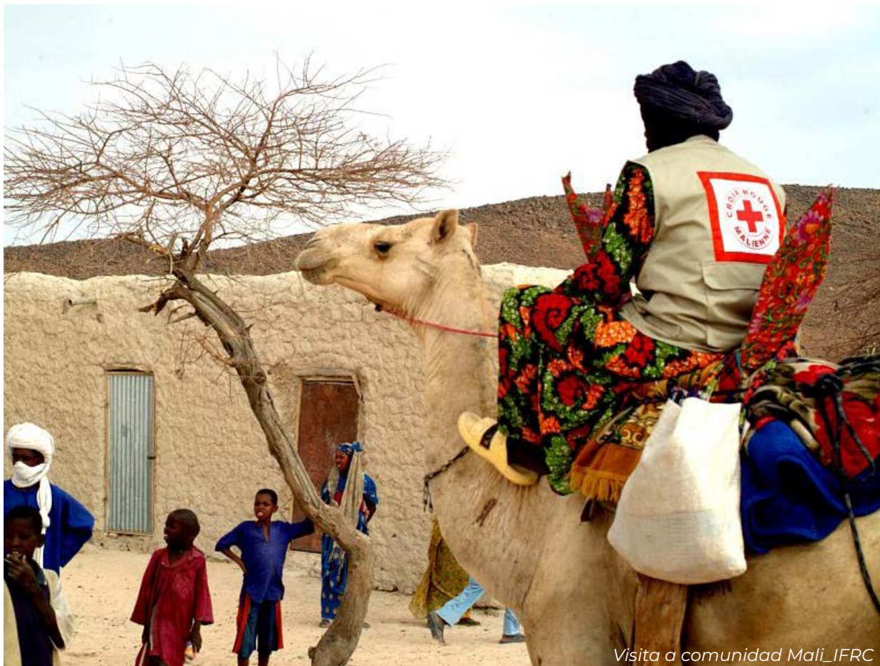
Visita a comunidad Mali_IFRC