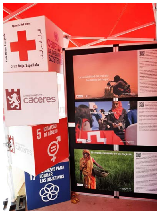
Exposición difusión cooperación