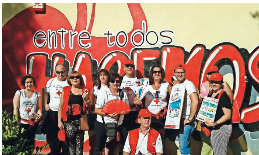
■ Venta interna de boletos por parte de Cruz Roja.

EL SORTEO DE ORO DE 2015 RECAUDÓ 5 MILLONES DE EUROS, QUE SE DESTINARON A INFANCIA HOSPITALIZADA, PERSONAS REFUGIADAS Y MUJERES EN SITUACIÓN DE VULNERABILIDAD