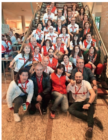
■ Delegación de Madrid en el Congreso Estatal celebrado en Valencia.