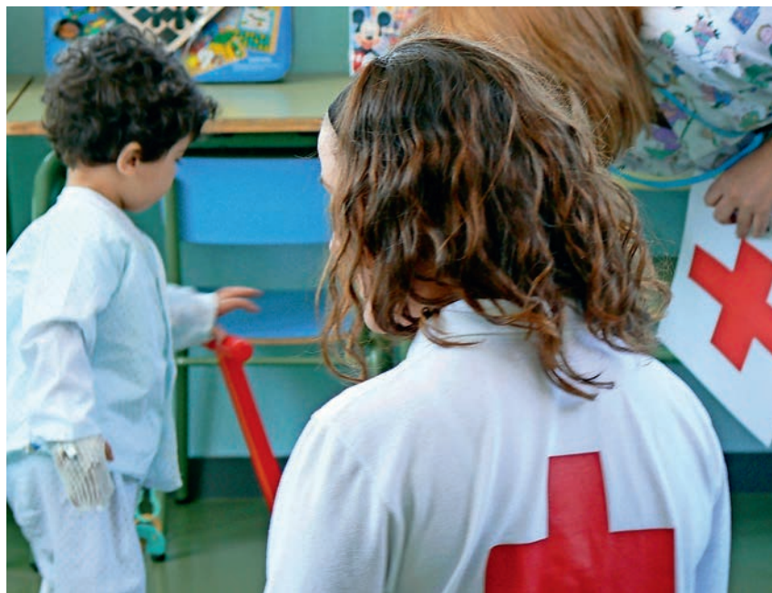
■ Infancia hospitalizada, un colectivo en el que Cruz Roja lleva años trabajando.

Para la organización es fundamental la implicación de todos sus miembros en la campaña y no sólo por la repercusión en el resultado final de la campaña. Contribuir con la venta interna hace que