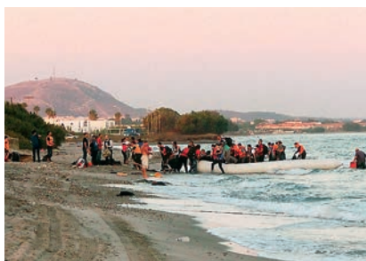
■ 50 refugiats provinents de Bodrum, Turquia, arriben en bot a l'illa grega de Kos.

Com el Saïd, prop de 1.150.789 refugiats han arribat a Europa entre 2015 i el que portem d'any segons l'ACNUR, mentre