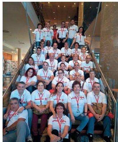
■ El voluntariado de Cruz Roja en Canarias que participó en el Congreso Estatal.

El primer trimestre del presente año el número de personas voluntarias de Cruz Roja Española en Canarias ya ascendía a más de 17.400. Asimismo, a finales del 2015 se llegaron a registrar más de 234.000 horas de trabajo a cargo del voluntariado. Horas de tiempo libre destinadas a mejorar la calidad de vida de otras personas.