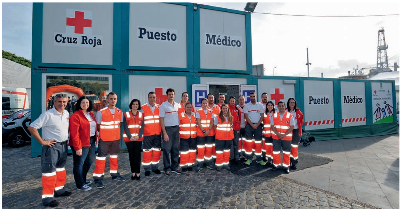
■ Parte del equipo de Cruz Roja que cubrió los servicios, en el Hospital del Carnaval de Santa Cruz de Tenerife.

Por último, Cruz Roja quiere resaltar la magnífica coordinación con todos los organismos intervinientes en todos estos dispositivos, así como agradecer la confianza que un año más han puesto en la Institución las diferentes Administraciones Públicas para que estas coberturas corran a su cargo.