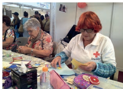
■ Taller de manualidades realizado con los usuarios del proyecto de 'Ayuda a Domicilio Complementaria'.

Pero Cruz Roja entiende que no se pueden ofrecer respuestas aisladas, porque estas se convierten en parches que no ayudan a las personas en riesgo de exclusión a salir de esta situación. Es necesario invertir para que logren integrarse socialmente y, para ello, la Institución cuenta con un consolidado Plan de Empleo , con más de 25 años de experiencia, gracias al cual, además de proporcionar ingresos y autonomía, se ofrece una fuerte red de relaciones sociales.