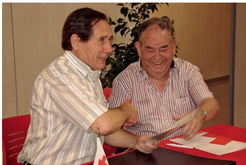
El presidente local de Cruz Roja en Las Palmas de Gran Canaria, junto al presidente provincial, en uno de los muchos encuentros que mantuvieron durante su etapa en Cruz Roja.

Presidía la Asamblea Local de Las Palmas de Gran Canaria.