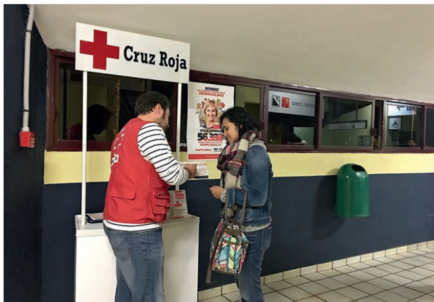
■ Un voluntario de Cruz Roja realiza captación de socios a pie de calle.

A finales de 2015 la Institución registró 64.451 socios en toda la comunidad autónoma, es decir, un 2,2% más que el año anterior, pero aun así es necesario un mayor apoyo de la sociedad para hacer frente a la situación de los colectivos más desfavorecidos. Gracias a estas aportaciones, que suponen cuotas a partir de tan solo 6 eu-