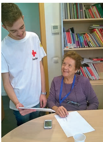
■ Un voluntario de Cruz Roja forma a una usuaria del proyecto Enréd@te en el uso de las Redes Sociales.

titución, siendo el eje principal de nuestra actividad. Su labor, dentro del proyecto de Salud Constante , consiste en realizar un seguimiento periódico de las biomedidas de los usuarios: tensión arterial, ejercicio, control del peso, recomendaciones de hábitos de vida saludables... con indicaciones concretas para mejorar su salud, además de talleres de prevención. Por otro lado, el proyecto Enréd@te se encarga de dinamizar y acompañar en las actividades de participación social y fomento de las relaciones sociales entre las personas mayores, además de generar actividades entre los usuarios a través de las nuevas tecnologías. Mientras, en el proyecto Atención a personas con funciones cognitivas deterioradas , su labor consiste en generar acciones formativas del tipo talleres, dirigidas a mejorar las competencias técnicas y/o personales de la persona mayor (memoria, atención, lenguaje, cálculo, orientación, razonamiento...) así como al acompañamiento en las actividades diarias.