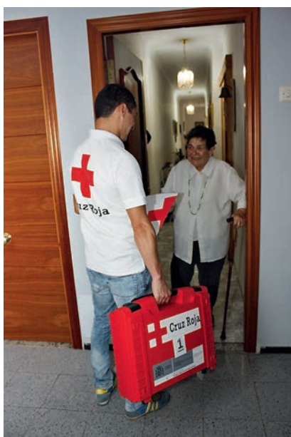
■ Visita al domicilio de una usuaria del proyecto de Salud Constante.

Estos proyectos se llevan a cabo con la participación del voluntariado de la Ins-