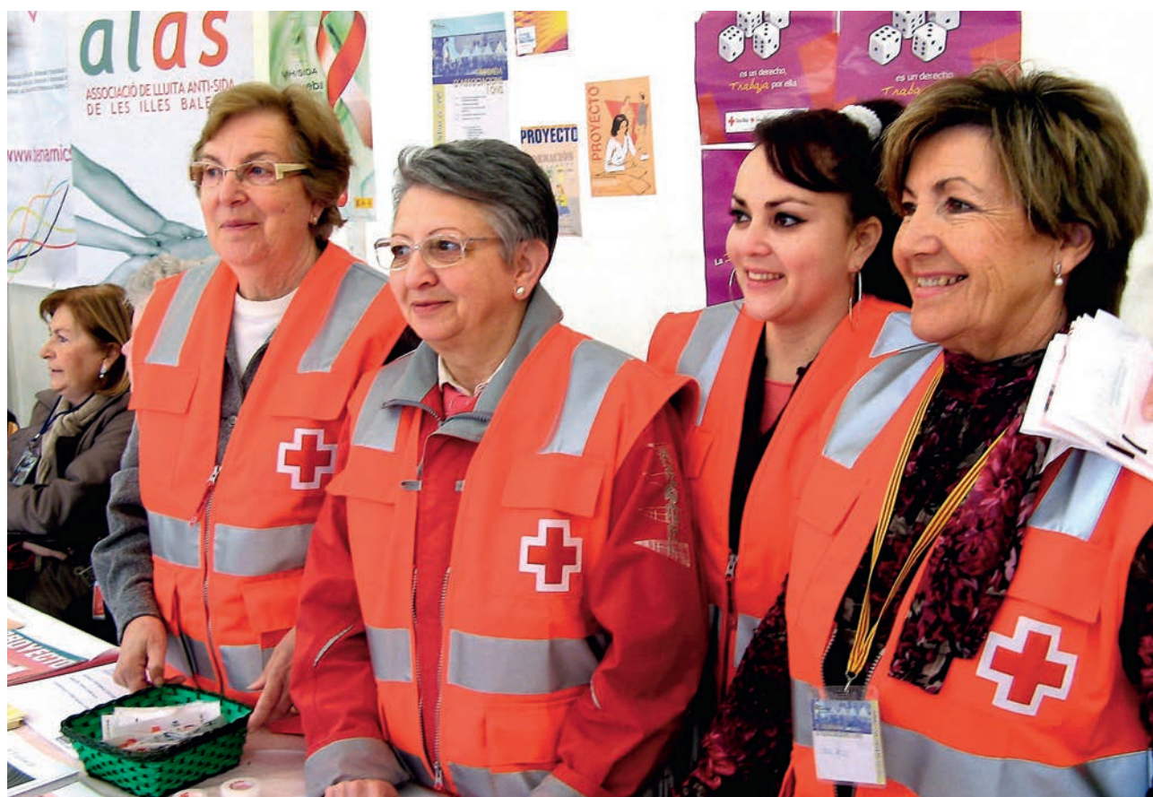
■ A Balears ja som més de 3.500 voluntaris i voluntàries.