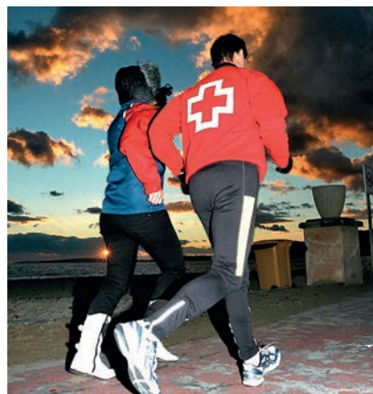
■ Dos cops a la setmana hi ha sessions esportives a Son Malferit.