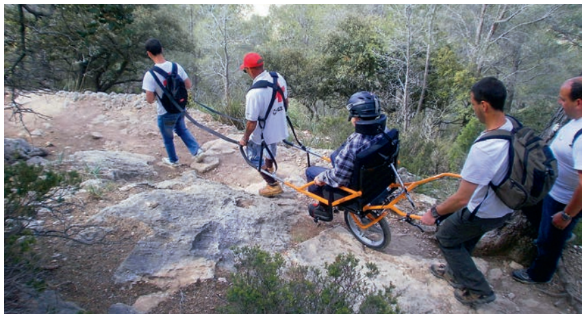
■ Apropam la natura a les persones més vulnerables.