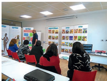
■ 'Congo itinerante' es una exposición sobre la realidad de este país africano.

Cruz Roja en Asturias acerca la República Democrática del Congo a través de una exposición itinerante.