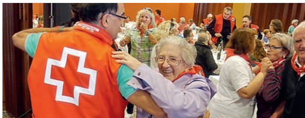
■ Moment del ball que es va celebrar després del dinar.