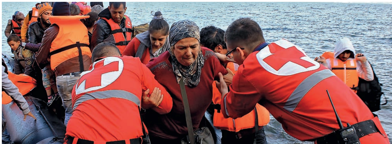
■ Arribada de la població refugiada a la costa grega.

LA CREU ROJA LLANÇA UNA CAMPANYA DE CAPTACIÓ DE FONDS PER ATENDRE ELS REFUGIATS A CATALUNYA.