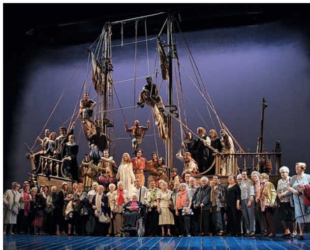
■ 10 representants de cada entitat social a l'escenari amb la companyia Dagoll Dagom.

Coincidint amb el Dia Internacional de la Gent Gran, l'1 d'octubre, es van aplegar al Teatre Victòria unes 1.000 persones grans ateses per les entitats socials Avismón Catalunya, Càritas Diocesana de Barcelona, Creu Roja i Amics de la Gent Gran, per gaudir de l'emblemàtic musical Mar i Cel de la companyia Dagoll Dagom.