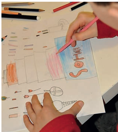
■ Foto d'arxiu d'un espai d'èxit escolar.