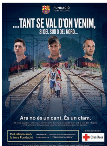
■ Cartell de la campanya 'Tant se val d'on venim' del F.C.Barcelona amb col·laboració de la Creu Roja.

Enmig de qualsevol gran drama humanitari, com el que suposa la crisi de població refugiada, sempre es troba algun alè d'esperança, com la gran onada de solidaritat que s'ha produït a casa nostra. Més de 4.700 persones, majoritàriament catalanes però també d'altres parts de l'Estat, s'han posat en contacte amb el Centre de Coordinació de la Creu Roja per oferir diferents tipus de suport a la població refugiada. A més dels particulars, són molts els municipis que volen ser