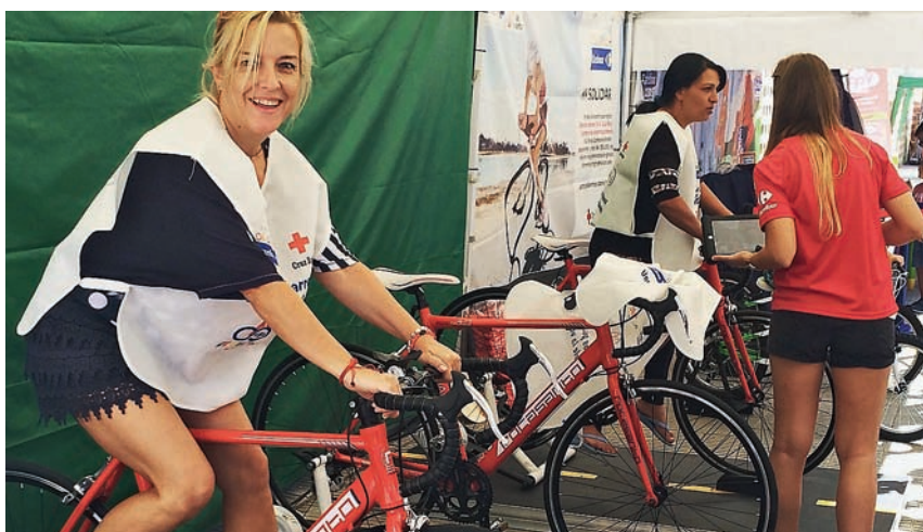
■ Carpa 'Km solidari' del Carrefour de Lleida.