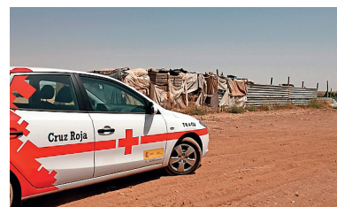
■ Cruz Roja visita los asentamientos de temporeros.