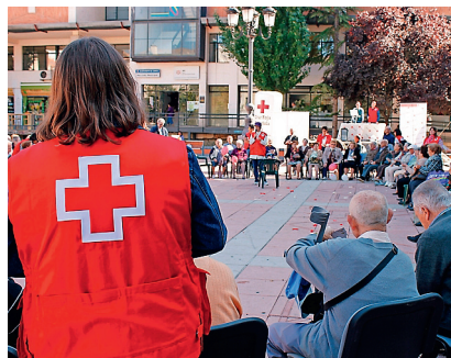
■ Los voluntarios desarrollan una importante labor en Cuenca y provincia.

miento en San Clemente, Las Pedroñeras y Tarancón, y otra sobre primeros auxilios, que se impartió en la Asamblea Local de Cuenca.