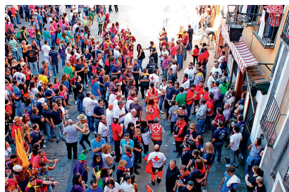
■ Salida de un equipo de socorro durante el festejo de vaquillas.