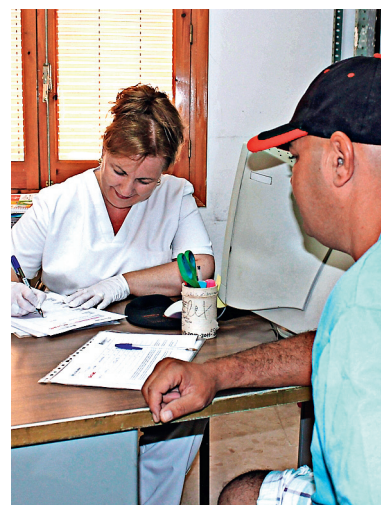
■ Asistencia Sanitaria en Las Pedroñeras.

Desde el año 1990, Cruz Roja en Las Pedroñeras pone sus instalaciones a disposición de los trabajadores temporeros de la campaña de recogida del ajo, una de las más importantes en la comarca de La Mancha.