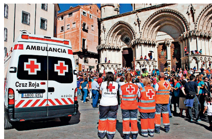
■ El dispositivo contó con dos ambulancias de S.V.B.

El equipo de voluntarios formado por 32 socorristas, 16 técnicos en emergencias sanitarias, cuatro enfermeros y un médico cirujano acometió 176 atenciones sanitarias durante las fiestas de San Mateo, y contó con el apoyo de un grupo de voluntarios de Cruz Roja de Albacete. En el dispositivo se han empleado dos ambulancias y un puesto de socorro y primeros auxilios que fue instalado en los arcos del Ayuntamiento, dotado con una sala de triaje, zona de observación, sala de curas, farmacia y quirófano.