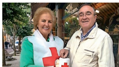
■ Día de la Banderita en Cangas del Narcea.