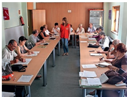
■ Voluntariado formado dirige el aula.

Estimulación cognitiva para mayores y apoyo a sus familias.