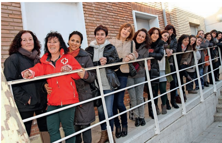
■ Participantes de la Escuela Taller de Empleo de Cintruénigo.

El proyecto cuenta con un planteamiento de prospección empresarial que permite crear sinergias entre las empresas y entidades de la zona que faciliten la inserción de las personas participantes a través de la intermediación laboral y el acercamiento al mundo laboral expuesto por el empresario.