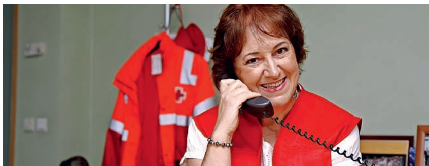
■ Voluntaria del Centro de Contacto.

Un servicio telefónico que ayuda en la soledad, en la dependencia, en las cargas de quienes tienen a su cuidado otras personas y se encuentran en riesgo de vulnerabilidad.