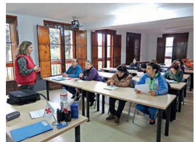
■ Participantes del proyecto Atlanta de Tudela.

El proyecto se desarrolla en Tudela y cuenta con prospección empresarial.