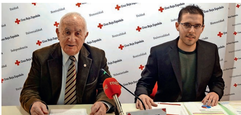
■ Presentación del Balance 2014.

La notable evolución que están experimentando ambos proyectos ( Acompañamiento a Jóvenes y Piso de Emancipación ) es posible gracias a un gran equipo de profesionales, formado por un coordinador, una psicóloga y tres trabajadoras sociales, y al estupendo trabajo de los voluntarios y