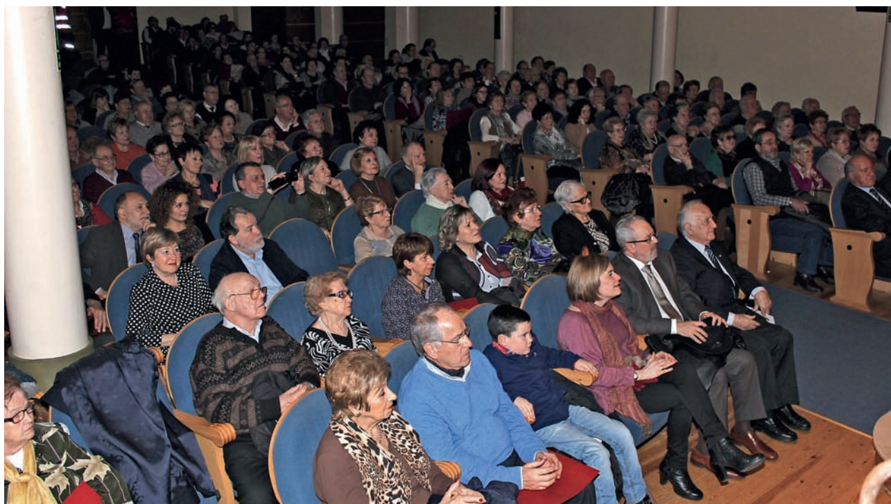
■ La Filmoteca colgó el cartel de completo.