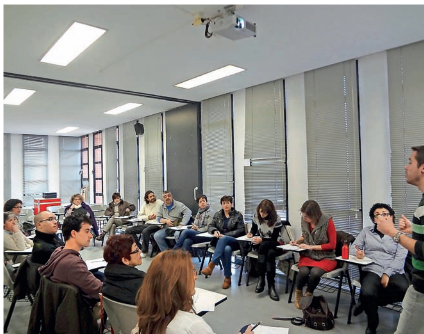
■ Asistentes al curso, adquiriendo conocimientos para resolver conflictos.

En el curso participaron un total de 16 voluntarios y voluntarias que quedaron muy satisfechos con los conocimientos adquiridos en el mismo. La jornada se repetirá en futuras ocasiones para que puedan asistir más personas.