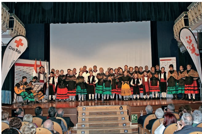
■ Actuación de la Escuela Riojana de Jotas.

GRACIAS A LAS APORTACIONES DE LOS SOCIOS SE PUEDEN LLEVAR A CABO ACCIONES COMO LA DISTRIBUCIÓN DE ALIMENTOS, AYUDAS DE PRIMERA NECESIDAD O APOYO EN LA BÚSQUEDA DE EMPLEO