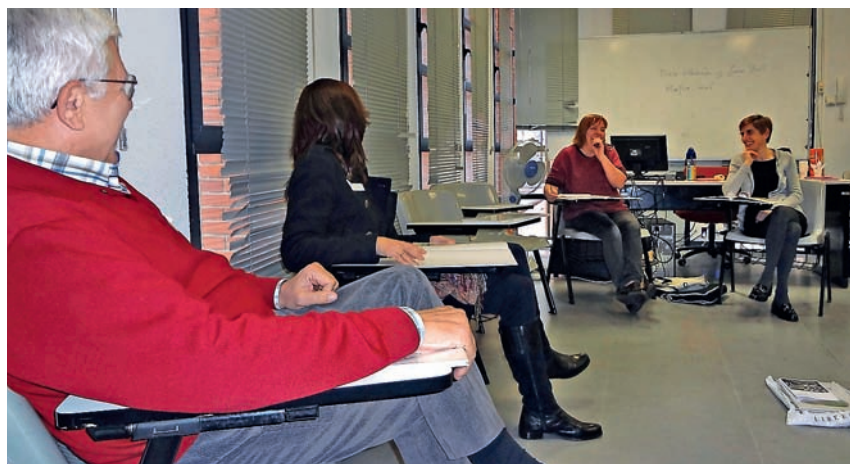
■ Momento de intercambio de opiniones.

Durante tres jornadas (18 de marzo y 15 y 22 de abril) se realizó la actividad de vida asociativa Café-Tertulia para voluntarios y voluntarias de Cruz Roja La Rioja.