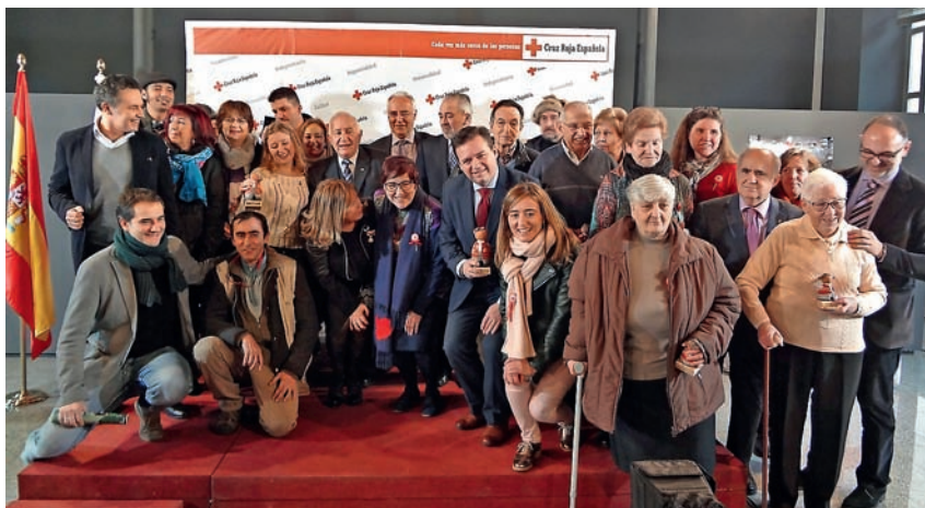
■ Foto de familia de los premiados.

Un día más tarde, el 13 de diciembre, se celebró el ya tradicional acto de reconocimiento a voluntarios y voluntarias, personalidades e instituciones. Este año fue más significativo si cabe, ya que supuso el broche final a un año de actividades conmemorativas del 150 Aniversario de Cruz Roja Española. Seguidamente, se ofreció un vino para las autoridades, una comida popular, sorteo de regalos, karaoke y disco-móvil.