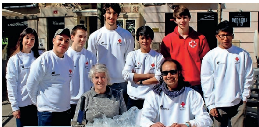
■ Participantes de la actividad.

El 28 de marzo, voluntarios y voluntarias del área de Medio Ambiente de Cruz Roja La Rioja celebraron en Logroño el Día Mundial del Agua 2015. Se llevó a cabo en la plaza del Mercado de la capital y estuvo dirigida a niños y niñas. Nueve voluntarios y voluntarias pusieron en marcha talleres para