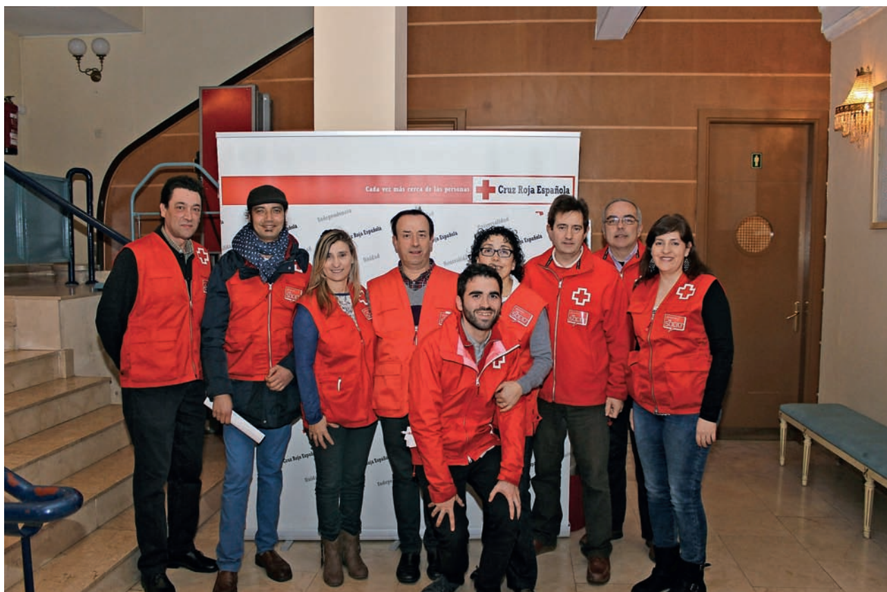
■ Voluntarios y voluntarias participantes en el acto.

CRUZ ROJA EN LA RIOJA ORGANIZÓ UN ACTO DE RECONOCIMIENTO A SUS SOCIOS Y SOCIAS MÁS VETERANOS EN LA CAPITAL RIOJANA. EL ACTO SE LLEVÓ A CABO DURANTE LA TARDE DEL VIERNES 20 DE FEBRERO.