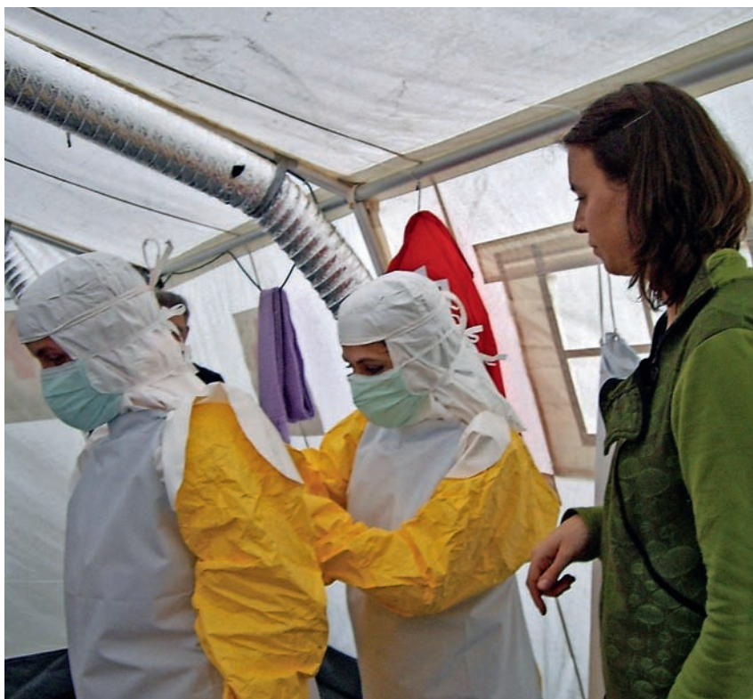
■ Tres personas participan en la supervisión de la colocación del traje de protección personal para que no haya ningún error.

Una manera de sensibilizarse es vivir la experiencia, aunque sea por unos minutos, de entrar en un recinto donde cada uno