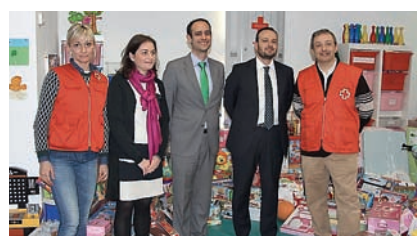
■ Acto de entrega de los juguetes.

Además, La Caixa donó material educativo para los niños ingresados.