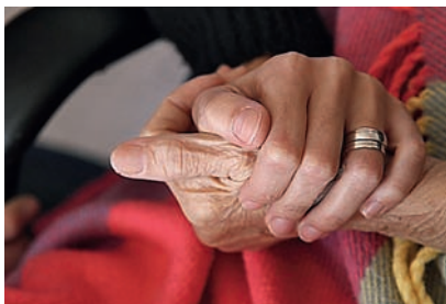
■ Humanidad, el pilar fundamental de la labor de los voluntarios.