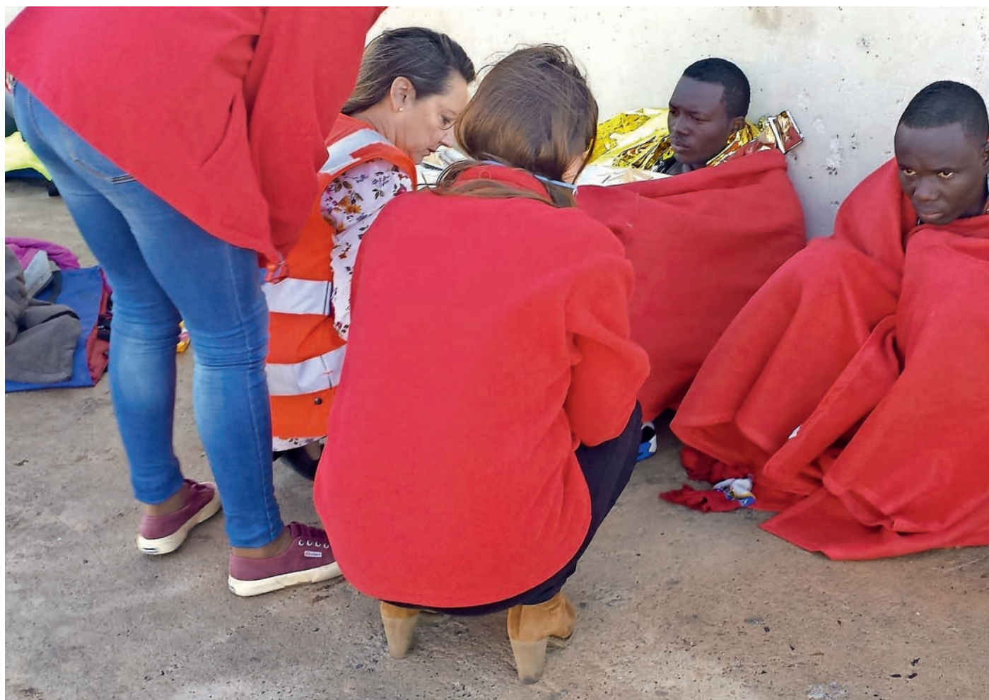
■ Se duplica la asistencia a personas inmigrantes.