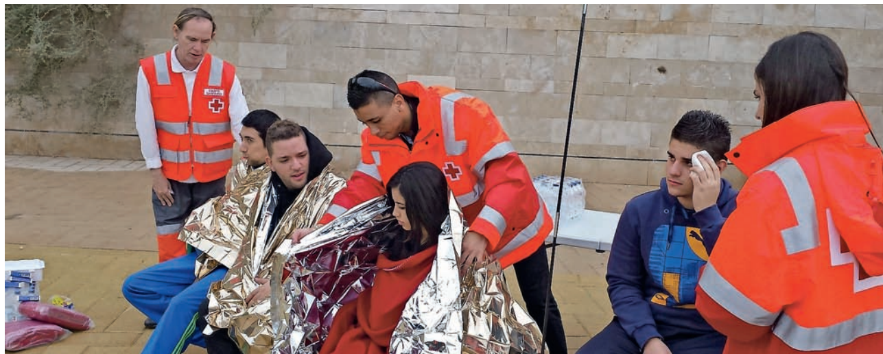
■ Cruz Roja en el Simulacro de la Unidad Militar de Emergencias.

A mediados del mes de noviembre del pasado año se realizó en la ciudad el tercer simulacro de intervención ante una catástrofe organizado por la Unidad Militar de Emergencias en colaboración con la Consejería de Seguridad Ciudadana. Como en ocasiones anteriores, se integró a Cruz Roja Española en los protocolos de actuación con la participación del ERIE Psicosocial y los equipos sanitarios. El amerizaje de un avión de pasajeros y la evacuación de las TorresV Centenario por un terremoto fueron los ejercicios en los que participaron nuestros voluntarios.