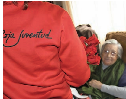
■ Los voluntarios de Cruz Roja Juventud de Ceuta en una de las visitas a los mayores.

ACOMPañAMOS A NUESTRO VOLUNTARIADO A UNA RESIDENCIA PARA CONOCER QUÉ HACEN Y EL VALOR DE SU ACTIVIDAD PARA EL DÍA A DÍA DE TANTAS PERSONAS DE LA TERCERA EDAD.