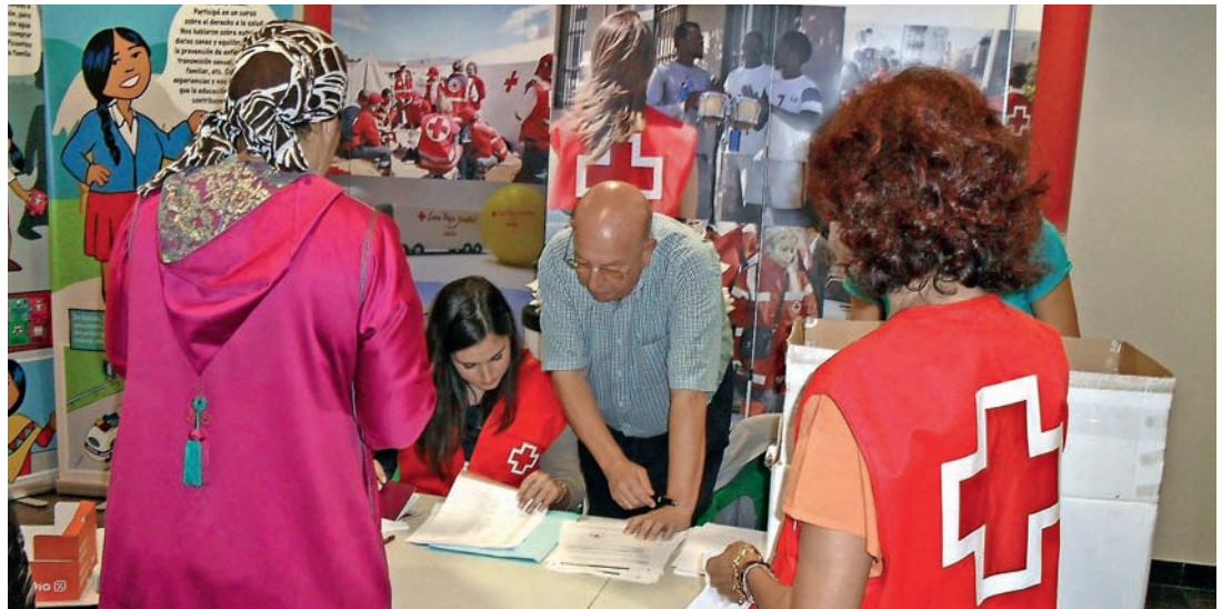
■ Entrega de desayunos solidarios a 250 menores.