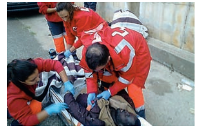
■ Persona inmigrante atendida por el ERIE de Cruz Roja Ceuta.