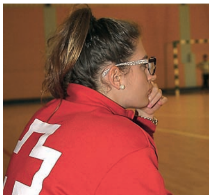
■ Voluntaria de Cruz Roja en un preventivo sanitario, durante un encuentro de fútbol sala.