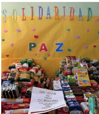
■ Entrega de alimentos.

Si en los dos primeros casos fueron las comunidades docentes de los dos centros educativos las que llevaron a cabo las aportaciones de alimentos, la tercera contribución procedió de los empleados y clientes de Bankia.