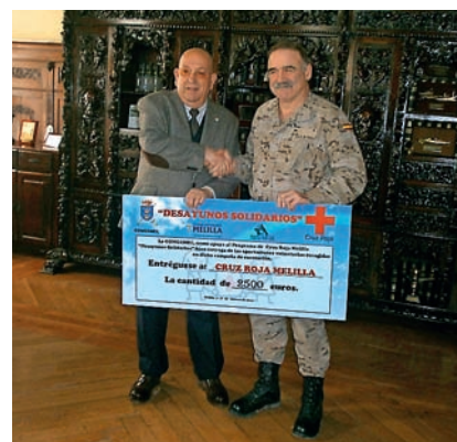
■ El comandante general hace entrega al presidente del Comité de la recaudación del concierto.

operaciones de paz llevadas a cabo por los cuerpos del Ejército y de diferentes actividades que Cruz Roja desarrolla en Melilla. La recaudación del acto, sumada a la cuantía realizada en los diferentes acuartelamientos, ascendió a 2.600 euros. Esto permite seguir proporcionando el desayuno durante dos meses a 250 menores en edad escolar, pertenecientes a familias en situación de vulnerabilidad.