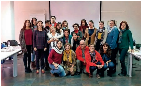
■ Se han realizado 40 cursos de formación, externa e interna.