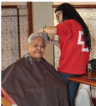
■ Los mayores reciben el cariño y el cuidado de los voluntarios.

Cruz Roja Ceuta, dentro de sus muchas actividades y servicios, ha puesto en marcha su programa de Ayudas Técnicas de Apoyo. Así, y mediante un simple formulario y la presentación del DNI, cualquiera que lo necesite, y en forma de préstamo, puede acceder al uso de sillas de ruedas, muletas, andadores, etc. Y siempre en función de la disponibilidad con el compromiso de devolverlo tras su utilización.