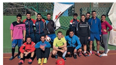
■ Parte de los participantes del Torneo de la Paz y la No Violencia.

El departamento de Voluntariado y Participación de Cruz Roja Ceuta organizó el Torneo de la Paz y la No Violencia, coincidiendo precisamente con la celebración de ese Día Internacional. Los voluntarios, procedentes de todas los departamentos y servicios de la Institución, formaron un total de seis equipos mixtos que compitieron por los trofeos. Desarrollado en el polideportivo de la Barriada Manzanera, este torneo estuvo presidido por el buen ambiente y por la deportividad.