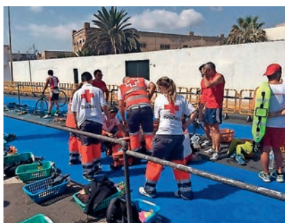
■ Realización de servicios preventivos durante todo el año.

Personas inmigrantes y familias en situación de vulnerabilidad fueron los colectivos con mayor número de atenciones a lo largo del año pasado por parte de Cruz Roja en Melilla.