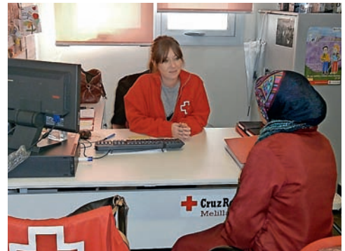
■ Atención integral a familias en dificultad social.

a 6.364 en 2014. Este aumento llevó a Cruz Roja a redoblar sus esfuerzos, tanto a nivel material como de recursos humanos: instalación de 21 tiendas de campaña en el recinto del Centro de Estancia Temporal de Inmigrantes, reparto de mantas, entregas de kits de vestuario, presencia continua en el centro (a solicitud de las autoridades competentes) y desplazamientos al perímetro fronterizo o a las costas para atender sanitaria y socialmente a las personas llegadas a la ciudad.