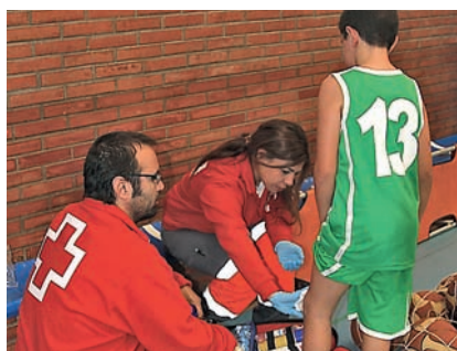
■ Voluntarios de Cruz Roja en un preventivo sanitario, en canchas de baloncesto.

No se concibe un encuentro de fútbol o baloncesto base sin los voluntarios de Cruz Roja Ceuta. Los convenios firmados con las federaciones de Fútbol y Baloncesto hacen que cualquier incidencia esté bajo control.