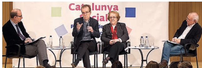
■ Presentació del dossier sobre ajuda alimentària.

Dignificar l'ajuda alimentària, acompanyant-la de mesures d'acompanyament. Aquests són els principals reptes descrits pel dossier Dignificar i defensar el dret a l'alimentació , elaborat per la Creu Roja per encàrrec de la Taula del Tercer Sector Social i presentat el