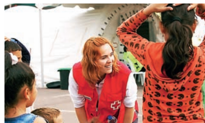
■ Actuació de la Creu Roja amb famílies afectades pel terratrèmol de Llorca (2011).

Per actuar davant de situacions d'emergència, la Creu Roja compta amb diversos recursos i equips, entre ells els anomenats ERIE (Equips de Resposta Immediata en Emergències). El suport psicològic i emocional a les persones afectades per situacions d'emergència o desastre és una de les especialitats d'aquests equips.