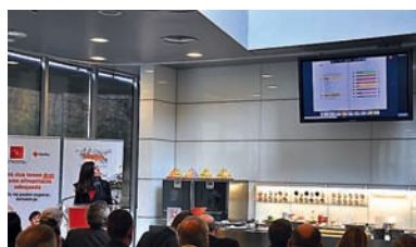
■ Presentació del receptari a la Fundació Alícia.