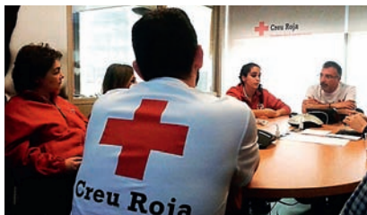
■ Reunió d'un dels equips de suport psicosocial després de tornar de França, al Centre de Coordinació.

En l'emergència declarada el passat 24 de març, després de saber que un avió procedent de Barcelona s'havia estavellat als Alps francesos, la Creu Roja va activar immediatament un protocol que començava amb una reunió d'urgència a la sala de crisi del seu Centre de Coordinació per establir quin operatiu es desplegaria i activar els recursos necessaris. Aquesta ràpida posada en escena va permetre des del moment zero que la Creu Roja fos present a l'aeroport del Prat per donar suport emocional a les primeres famílies que s'hi van acostar i, posteriorment, a la resta d'escenaris on la institució humanitària va acompanyar les persones afectades.