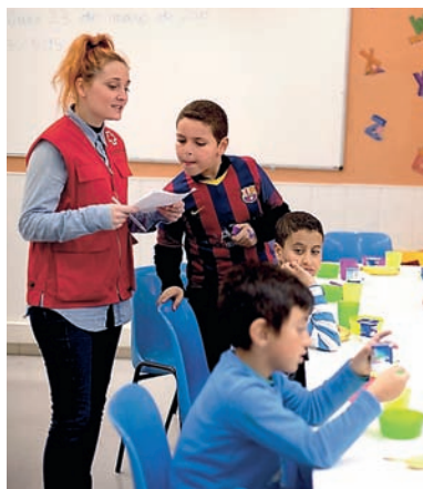
■ Projecte d'Èxit Escolar de Creu Roja Joventut a Sabadell.