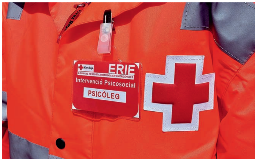
■ La Creu Roja va donar suport social i psicològic a alumnes i docents.

El dia de l'accident, el 24 de març, tres persones de l'equip tècnic de la Creu Roja i 14 voluntàries van fer una primera intervenció al centre amb el professorat, els alumnes i els