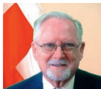
■ Antoni Aguilera i Rodríguez, president de la Creu Roja a Catalunya des de 20 d'abril de 2015.

El tràgic succés que va tenir lloc als Alps francesos el mes de març i que ens ha colpit a tots per la gran proximitat i el dolor causat a tantes famílies ha portat a la Creu Roja a destinar tots els esforços davant d'aquest repte humanitari, amb la voluntat de posar-nos al servei de les persones més vulnerables.