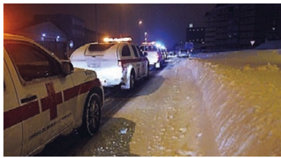
■ Convoy de vehículos formado para trasladar a los afectados por la nevada.

Otra de las actuaciones realizadas, en este caso relacionada con las crecidas de los cauces fluviales, obligó en enero a intervenir de manera coordinada con el Gobierno de Cantabria. Se desarrolló un operativo de emergencia en varios ríos, rescatando a dos personas de sendos coches; en Viño de Piélagos se colaboró en el rescate de animales atrapados y finalizó con éxito la búsqueda