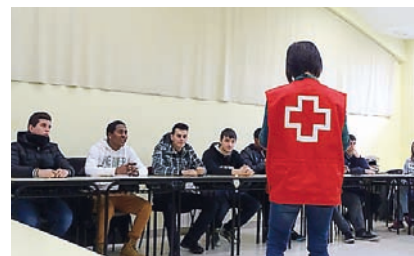
■ Impartición de un taller de empoderamiento por una voluntaria.

Con esta acción se busca la colaboración de los empleadores, conociendo los perfiles demandados y orientando las acciones formativas emprendidas. Se realizaron visitas guiadas a Eroski Center, Fundación Laboral del Metal, Toys'R'us, Mercadona, Hotel Sardinero, Ho-