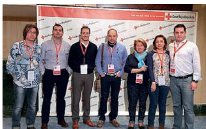
■ Representación cántabra en la Asamblea General.

Una delegación de Cantabria estuvo en la VIII Asamblea General de Cruz Roja que se desarrolló entre los días 6 y 8 de marzo en Madrid. Entre otros asuntos tratados, se aprobó el documento marco con los objetivos a alcanzar durante el periodo 2015-2019. En este se incluyen las líneas de trabajo a desarrollar para el impulso de su labor de atención social y humanitaria. En los próximos cuatro años, la Institución se propone velar por una Cruz Roja con principios y valores que res-