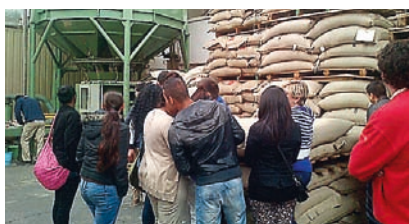
■ Visita a una empresa con participantes del Plan de Empleo.

Durante 2014, se realizaron 473 contactos con empresas de distintos sectores. La labor que se realiza va desde la información sobre el Plan de Empleo a la intermediación y prospección empresarial. En este sentido, se organizó una charla en la que participaron responsables de recursos humanos de Eulen, Flexiplan, Adecco y la Escuela de Reyes.