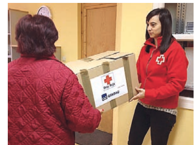
■ Entrega de alimentos en la Asamblea de Reinosa.

En febrero de 2015 se ha puesto en marcha, en la Asamblea Local de Renedo de Piélagos, Cruz Roja Juventud.