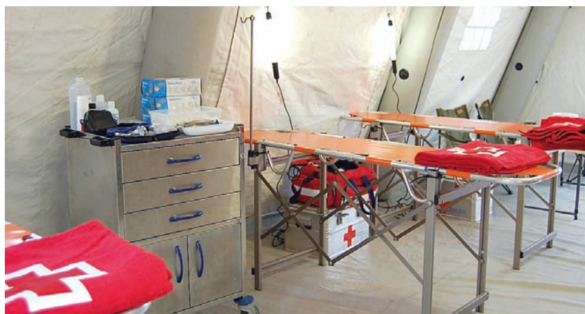
■ Hospital de campaña instalado en Santoña durante el carnaval.

Una de las iniciativas desarrolladas para consolidar las relaciones con el empresariado de Cantabria fue un desayuno de trabajo en Puente Viesgo. Como conclusiones, destacan la necesidad de continuar desarrollando líneas de acción en la formación prelaboral, preselección de candidaturas y seguimiento en el empleo. Asimismo, se destaca una satisfactoria colaboración con los empleadores, tomando como guía las recomendaciones y propuestas actuales de los empresarios.