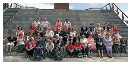
■ Visita al Museo Marítimo del Cantábrico con usuarios del proyecto de Teleasistencia.

El servicio funciona 24 horas al día durante los 365 días del año. Además, se realiza un seguimiento permanente de los usuarios, tanto desde la central de Teleasistencia, a través de las llamadas telefónicas, como mediante las visitas a domicilio realizadas por personas voluntarias y personal técnico. Periódicamente se realizan encuestas a los usuarios para conocer el grado de satisfacción con el servicio, donde se pueden trasladar a su vez las sugerencias, quejas o propuestas de mejora.