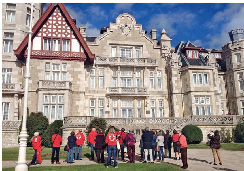
■ Más de 13.000 personas resultaron beneficiarias de los proyectos de Cruz Roja durante 2014.

Hacemos balance de los logros alcanzados durante el pasado año, en el que continuó incrementándose el número de personas atendidas.