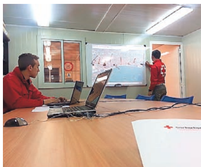
■ La formación abarca desde la sensibilización a la capacitación de sus destinatarios.

La formación en Cruz Roja es uno de los pilares fundamentales de la Institución. Su enfoque es holístico y trata de ahondar en aspectos fundamentales que van desde la sensibilización a la capacitación de sus destinatarios en distintos aspectos. Por este motivo, durante 2014 en Cantabria, se desarrollaron un total de 239 cursos que contaron con la participación de 2.224 alumnos y alumnas.