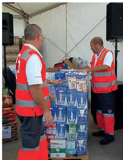
■ Recogida de alimentos en Fuerteventura.

Desde Cruz Roja Canarias, una vez más, queremos dar las gracias por la colaboración solidaria que ayuda a mejorar la calidad de vida de las personas más desfavorecidas.