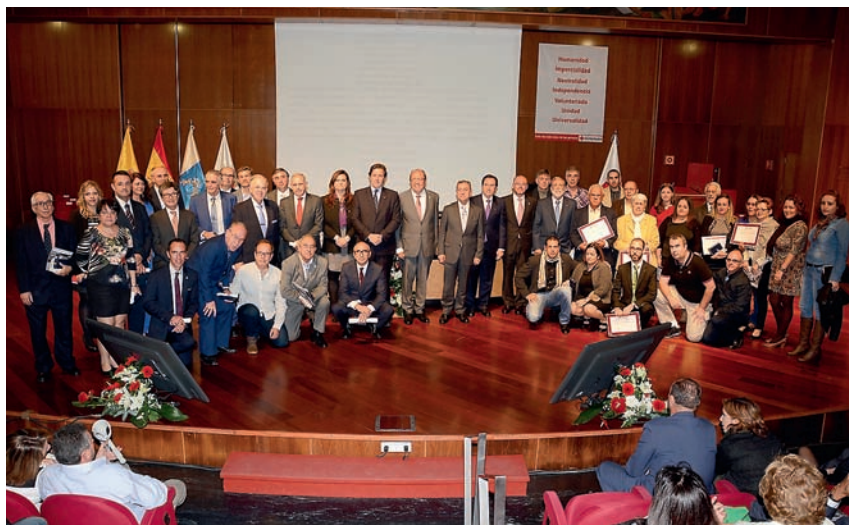
■ Foto de familia con los homenajeados.

EL ACTO TUVO LUGAR EL PASADO MES DE DICIEMBRE EN EL PARANINFO DE LA UNIVERSIDAD DE LAS PALMAS DE GRAN CANARIA, RESALTANDO DE MODO ESPECIAL EL 150 ANIVERSARIO DE LA FUNDACIÓN DE CRUZ ROJA ESPAÑOLA.