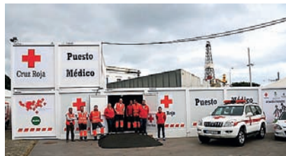
■ Dispositivo desplegado por Cruz Roja durante los carnavales celebrados en Santa Cruz de Tenerife.

En cuanto a la cobertura socio-sanitaria prestada en Las Palmas de Gran Canaria, en coordinación con el Ayuntamiento de la ca-