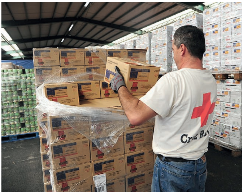
■ Personal de Cruz Roja prepara la distribución de los alimentos llegados del FEGA.

También se han distribuido 1.407.245 kg. de alimentos del Plan 2014 del Fondo Español de Garantía Agraria (FEGA) a 130 entidades benéficas, entre las que se encuentran Asambleas Locales de Cruz Roja, entidades, asociaciones y ayuntamientos, que han alcanzado a 120.087 personas.