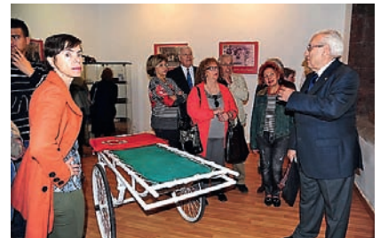
■ Momentos de la visita guiada por la exposición.

ESTA MUESTRA, COMPUESTA POR FOTOGRAFÍAS, MEDALLAS, LIBROS Y DEMÁS RECUERDOS, DIO A CONOCER LA HISTORIA Y EVOLUCIÓN DE LA INSTITUCIÓN DESDE SU FUNDACIÓN EN EL AÑO 1864