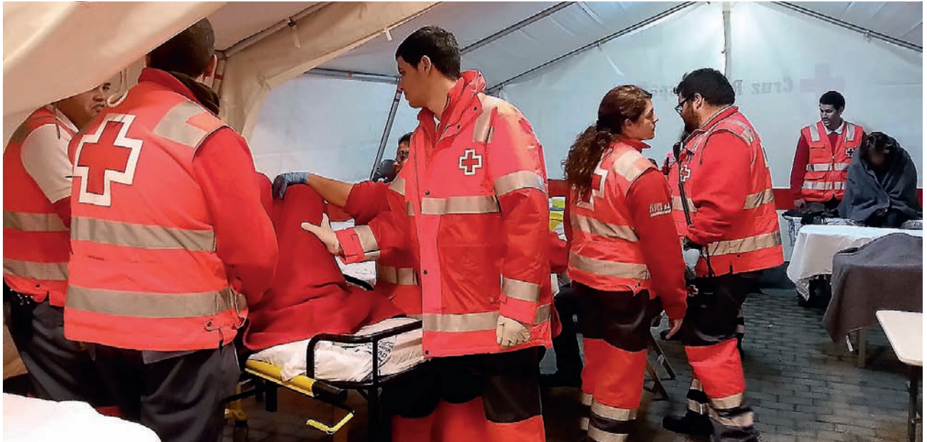
■ Equipo de la cobertura socio-sanitaria prestada en la isla de Lanzarote.

Igual que en años anteriores, la Institución vela por la seguridad sanitaria gestionando un puesto avanzado en todos los actos festivos.