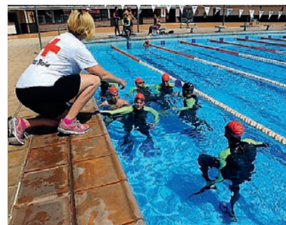
■ El alumnado de Rescata+ (2ª edición), en la piscina municipal de Santa Cruz de Tenerife, realizando prácticas de socorrismo en instalaciones acuáticas.

Además de la labor de atención primaria, a finales de 2014, ya se habían atendido a 3.720 usuarios a través de los servicios que tiene la Institución en materia de empleo en esta comunidad autónoma. 583 personas se han incorporado al mercado de trabajo.