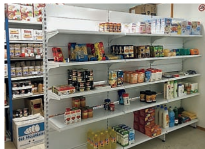
■ Ferreries promou un sistema d'entrega d'ajuda pioner a l'illa.

Els usuaris del servei, mitjançant una targeta de punts, podran adquirir aliments, productes d'higiene bàsica i de neteja de la llar.