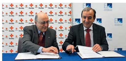
■ Endesa, una vegada més, s'implica en el programa d'urgències socials.

L'actual situació econòmica i social ha contribuït a deteriorar les condicions de vida de la nostra societat i ha afectat, especialment, a la població més vulnerable: