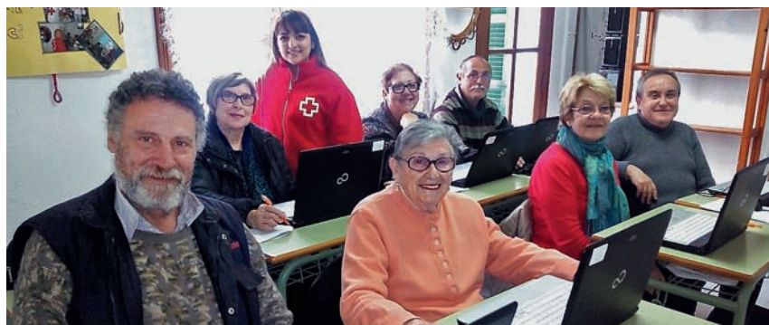
■ Participants del darrer taller d'ordinadors impartit a Manacor.

EL 2014 L'ENTITAT A FERRERIES VA ENTREGAR MÉS DE 100 LOTS D'ALIMENTS BÀSICS QUE VAREN BENEFICIAR A MÉS DE 35 FAMÍLIES