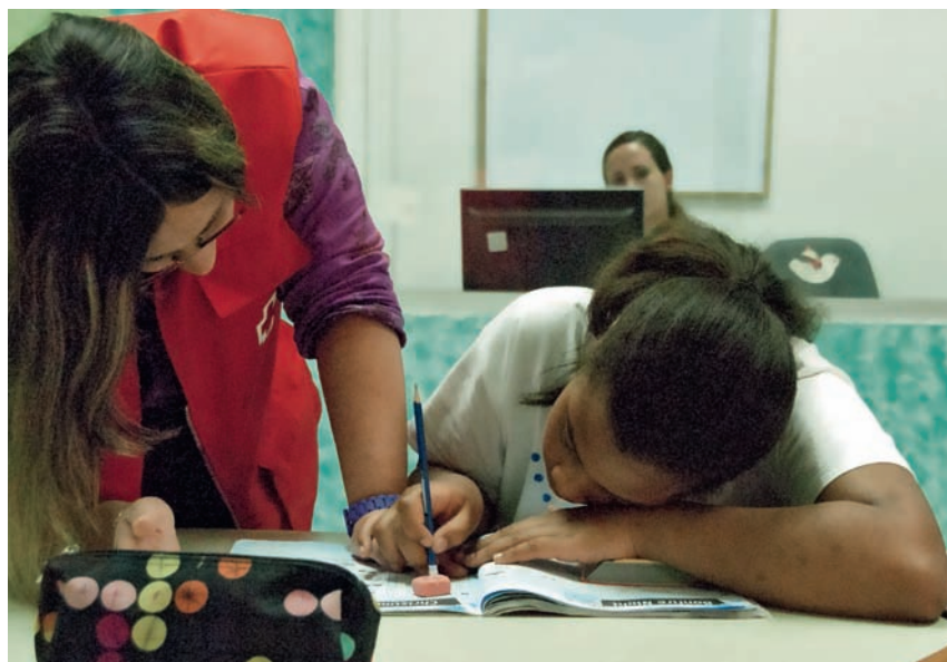
■ Els voluntaris són els responsables de donar suport en les tasques escolars.

A TRAVÉS DEL PROJECTE PROMOCIÓ DE L'ÈXIT ESCOLAR, LA CREU ROJA JOVENTUT OFEREIX SUPORT EDUCATIU I LLIURAMENT DE MATERIAL ESCOLAR A LES FAMÍLIES QUE MÉS HO NECESSITEN.