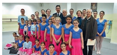
■ Els alumnes entreguen el donatiu a les entitats beneficiàries.

L'Escola de dansa Francisca Tomàs organitza un espectacle solidari per donar els beneficis als programes d'ajuda a la infància.