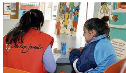
■ Promovem una dieta saludable i equilibrada.

Voluntaris reparteixen 18.200 berenars als nins i nines participants del programa d'Èxit Escolar amb l'objectiu de pal·liar possibles deficiències alimentàries, especialment en la ingesta de fruites, cereals i productes làctics, i alhora, minimitzar l'impacte de la crisi entre les famílies més desfavorides.