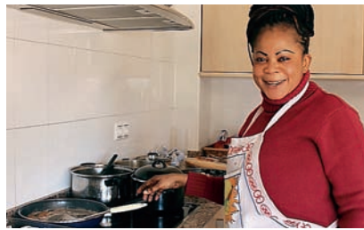
■ Participant del curs d'auxiliar de cuina de la Creu Roja a Palma.

La Institució a les Balears fomenta la igualtat d'oportunitats a través de diferents línies de treball: suport a les polítiques d'igualtat, sensibilització sobre la importància que tota la societat s'impliqui de manera corresponsable en aquesta tasca i la posada en marxa de projectes per donar suport a les dones més vulnerables (dones que pateixen violència de gènere, dones en situació de pobresa, dones immigrants, dones amb responsabilitats familiars, etc.).