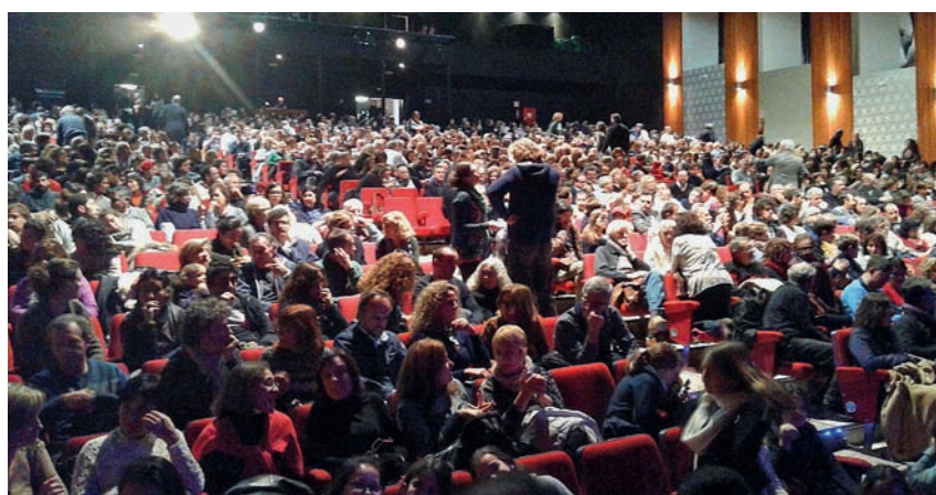
■ Més de 1.000 persones assisteixen a l'espectacle solidari.

del Servei d'Atenció d'Urgències Socials (SAUS) i consistiran en la donació d'aliments, medicines, pròtesis, productes d'higiene personal i de la llar, així com material escolar i el pagament puntual de subministres i lloguers. El concert va comptar amb gran afluència de públic malgrat que el programa de l'actuació va ser una sorpresa fins al mateix moment de la funció. Tot i ser una incògnita, el públic va vibrar amb la personalitat de Malikian que liderava l'actuació.