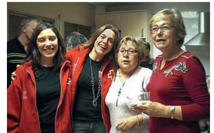
■ La Creu Roja sempre a prop de les persones que més ho necessiten.

de dones enquestades que pateix o ha patit violència de gènere és molt superior al de les dones de la població general, el 5,51 per cent ha sofert situacions de violència. D'altra banda, l'assetjament laboral i l'assetjament sexual en l'àmbit del treball presenten també indicadors molt elevats.