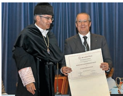
■ El presidente de CRE en Huelva recibe la Medalla de manos del Rector.

En el acuerdo de concesión de la Medalla a Cruz Roja de Huelva, la UHU pone de relieve "la condición de Institución humanitaria de carácter voluntario e interés público, los principios, objetivos y fines que la rigen, en