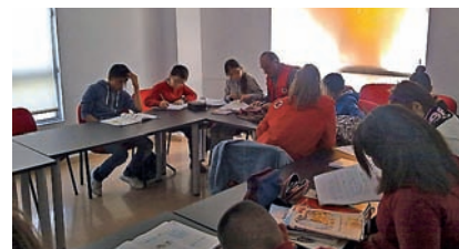
■ Apoyo educativo a niños.