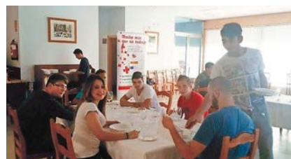
■ Alumnado del Curso de Servicio Básico de Restaurante y Bar (Proyecto Formación para el empleo con jóvenes de Garantía Juvenil).

LOS PROYECTOS DE GARANTÍA JUVENIL EN SEGOVIA SE DESTINAN A MENORES DE 30 AÑOS SIN TRABAJO.