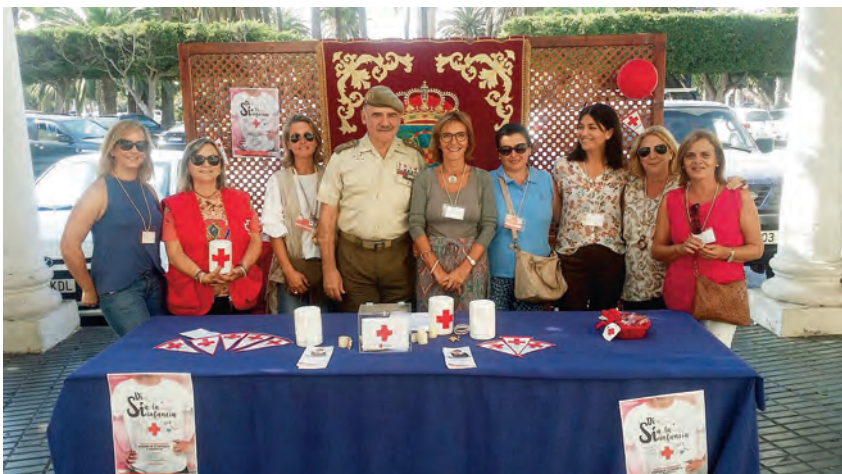
► Mesa de la Comandancia General de Melilla.

Garantizar un rendimiento escolar apropiado así como aminorar los riesgos de sufrir fracaso y abandono escolar con unos recursos mínimos son algunos planes dirigidos a la infancia