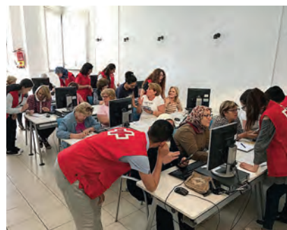
Curso para mayores de nuevas tecnologías.

Además, nuestra Asamblea cuenta con el Servicio de Ayuda a Domicilio Complementaria donde proporcionamos a la persona mayor una promoción de su autonomía personal, escucha activa y el desarrollo de actividades cotidianas bajo la supervisión del voluntario o la voluntaria