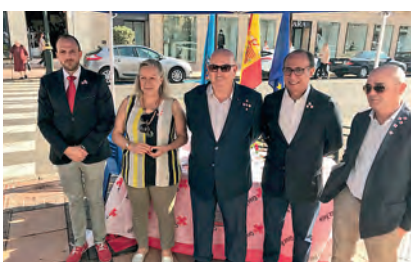
► Mesa de la Delegación del Gobierno.

Garantizar un rendimiento escolar apropiado así como aminorar los riesgos de sufrir fracaso y abandono escolar con unos recursos mínimos son algunos planes dirigidos a la infancia