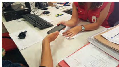
Entrega del terminal de ATENPRO.

El Servicio Telefónico de Atención y Protección para víctimas de la violencia de género (ATENPRO) está activo las 24 horas del día todo el año y ofrece una atención inmediata.