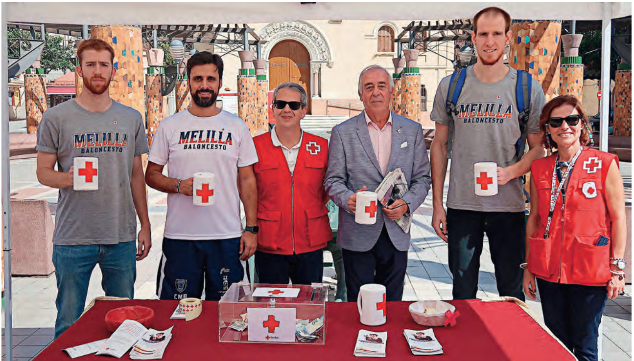
► Melilla Baloncesto colabora con Cruz Roja.