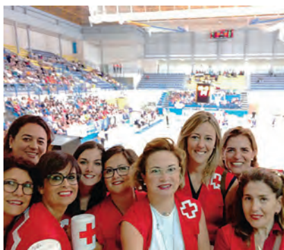
► Cuestación en el partido del Melilla Baloncesto.

Con más de 100 años de historia, el principal objetivo del Día de la Banderita es obtener fondos para los colectivos más vulnerables y mostrar la labor de la Institución