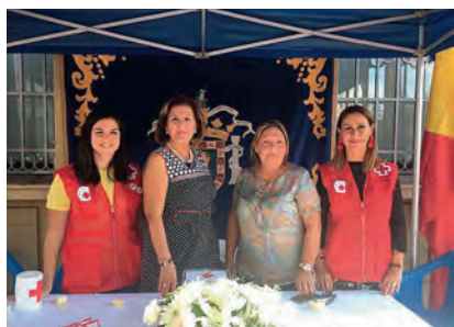
► Mesa de la Ciudad Autónoma de Melilla.

Un año más nuestra Asamblea celebró su tradicional Día de la Banderita.