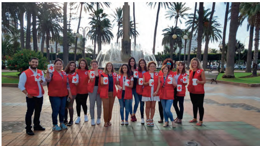
► Grupo de voluntarias con sus huchas.

B ajo el lema ‘Di sí a la infancia’, el día 5 de octubre los alumnos y alumnas del colegio Anselmo