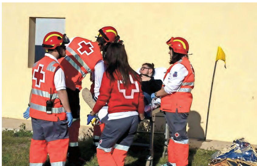
► Simulacro con la Unidad Militar de Emergencia.

En el año 2016 fueron 5.695 las personas atendidas dentro del Programa de Inmigrantes . En el mes de diciembre se puso en marcha el programa de primera acogida en frontera, que incluye la prestación de ayuda psicosocial a personas solicitantes de asilo en la frontera de Beni-Enzar recién llegadas a Melilla.