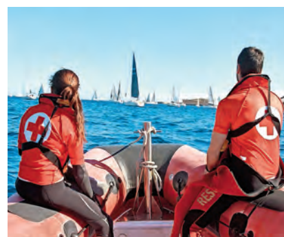
➤ Uno de los momentos de la regata.

Como es habitual en todas las actividades preventivas sanitarias, el voluntariado de Cruz Roja desplazado a la prueba se encontraba plenamente capacitado para atender cualquier contingencia que se hubiese presentado, trasladando a un centro sanitario a las personas que lo hubieran necesitado.