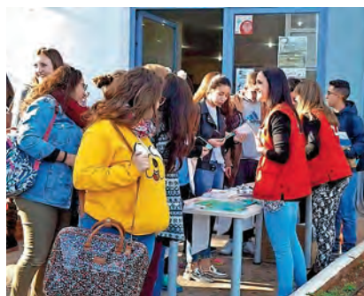
▶ Sensibilizando a los jóvenes.

El Programa de Ayuda Alimentaria a las personas más desfavorecidas se lleva a cabo en tres fases. En cada una de ellas Cruz Roja reparte alimentos procedentes de excedentes de la Unión Europea a través de distintas asociaciones de nuestra ciudad. Durante el Plan 2016, Cruz Roja Melilla repartió 321.338 kilos de alimentos entre 6.700 personas distribuidas en distintas asociaciones. Por citar solo algunas, mencionaremos el Colegio de la