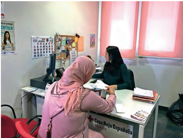
► La importancia de la atención individual.