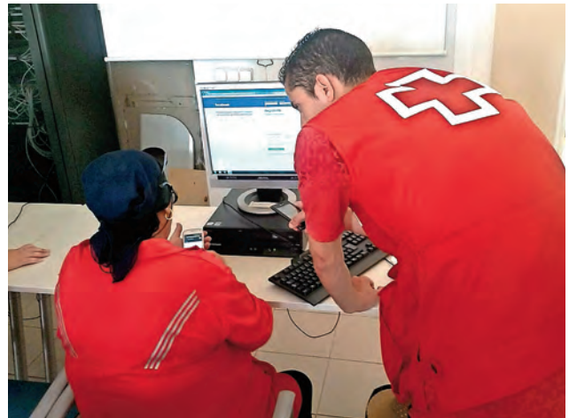
► Enseñando las nuevas tecnologías a nuestros mayores.

Durante el año pasado, Cruz Roja Melilla participó en diferentes eventos que se llevaron a cabo en la ciudad. Cabe mencionar la celebración de la IV Carrera Africana, la Cabalgata de Reyes, el Carnaval y la Segunda Carrera Nocturna de Cruz Roja. Hay que destacar también la participación de Cruz Roja en numerosas pruebas deportivas que, tanto de nivel local como nacional, se han desarrollaron en nuestra ciudad. En total, 10.470 personas fueron atendidas en este proyecto.