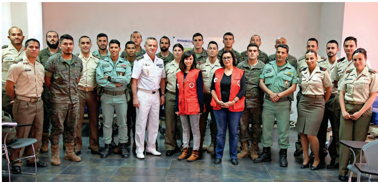
▶ Formación sanitaria a miembros de nuestro Ejército.

Más de 25.000 personas fueron atendidas por Cruz Roja en Melilla a través de sus diferentes proyectos de atención integral para personas vulnerables.