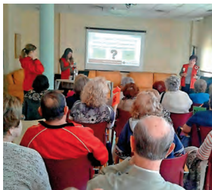
▶ Nuestros voluntarios, siempre al lado de nuestros mayores.

N uestros mayores continúan siendo uno de los colectivos prioritarios de atención para Cruz Roja Española desde hace décadas. Con la puesta en marcha del Programa Red Social de Personas Mayores pretendemos mejorar las relaciones sociales de estas personas con su entorno cercano y comunitario. El objetivo general del Programa de Personas Mayores de Cruz Roja es mejorar la calidad de vida de este colectivo en su proceso de envejecimiento, contribuyendo a crear o a establecer un estado de bienestar biopsicosocial y relacional. El programa lleva a cabo una serie de actividades de di-