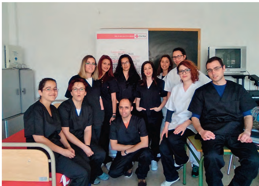
► Nuevo equipo de voluntarios y voluntarias de la asamblea local.