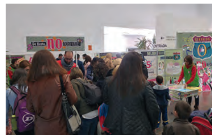
► Intervención del voluntariado de Cruz Roja Juventud para promover la reducción de riesgos en espacios de ocio.

El proyecto Riesgos 0. Juega tus cartas ha atendido de forma directa a 922 jóvenes en distintas actividades. Para ello se ha creado una estrategia digital que incluye la difusión de contenidos en redes sociales insti-