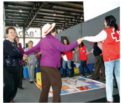
► Un equipo de Cruz Roja durante una de las actividades para mayores.