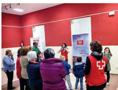
■ Voluntarios de Cruz Roja, con personas mayores en el 'Programa de Salud Constante'.

En el marco de este objetivo estratégico para nuestra institución, en Mérida y Cáceres quisimos poner en valor la larga trayectoria de colaboración con las diferentes instituciones extremeñas y el gran apoyo de sus ciudadanos hacia Cruz Roja para atender las necesidades de los más vulnerables más allá de nuestras fronteras. En estas localidades, el voluntariado de la organización realizó una muestra abierta a todos los públicos para dar a conocer los materiales que hemos utilizado en las úl-