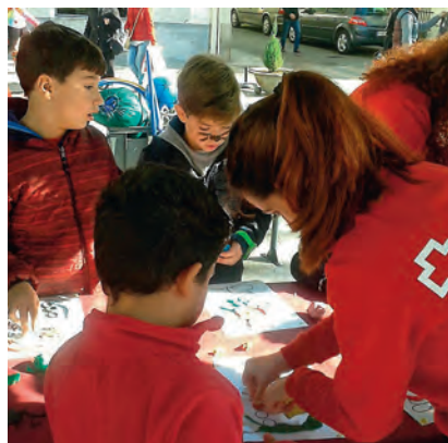
► Voluntarios de Cruz Roja Juventud, trabajando con las personas en materia de coeducación y perspectiva de género.

Por ello, durante la semana del Día Internacional de la Mujer, celebrado el pasado 8 de Marzo, el voluntariado de CRJ en Extremadura organizó una amplia serie de jornadas, rutas senderistas, stands informativos y talleres en toda la región. El lema de la campaña fue en esta ocasión 'Y tú... ¿qué fórmula utilizas?', con en el que se pretendió visibilizar nuestras acciones en pro de la equidad. Todo el el voluntariado de Cabeza del Buey, Cáceres, Cañaveral, Don Benito,