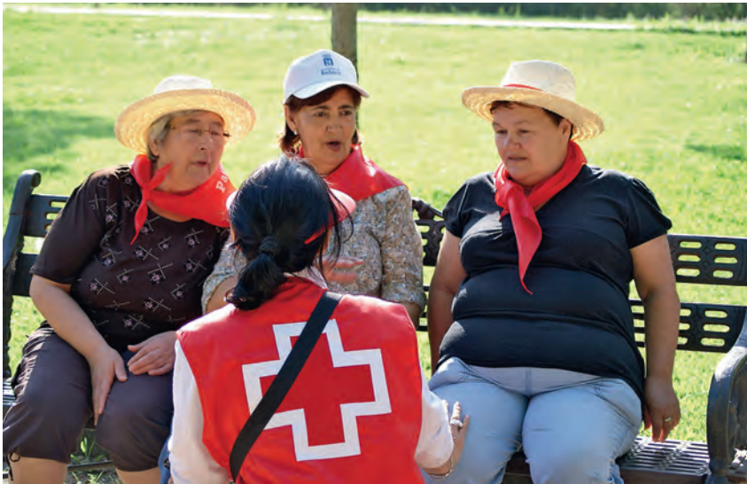
► Una actividad organizada en la Feria de los Mayores de Extremadura.