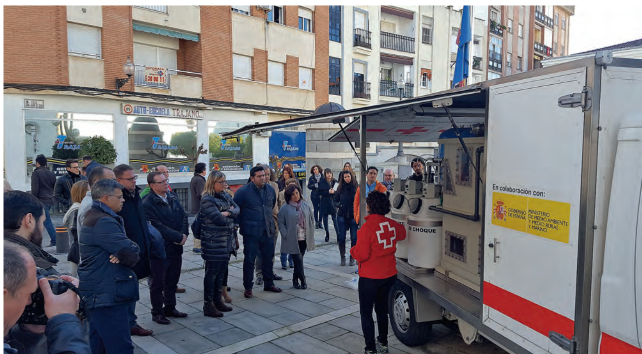
▶ Diputados de la Asamblea de Extremadura, junto al presidente autonómico, durante la explicación de una planta potabilizadora.

La paz, la mejora de la convivencia, la interculturalidad y la equidad de género, objetivos estratégicos de la organización en sus distintos actos.