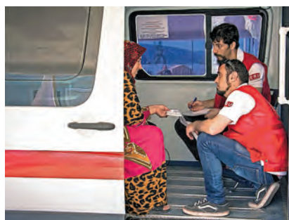
► Membres de la Creu Roja, atenent una dona refugiada a Skaramagas (Grècia).

Malgrat això, l'organització humanitària segueix garantint menjar a 45.000 persones al dia, a més de cobrir altres necessitats bàsiques (aigua potable, mantes