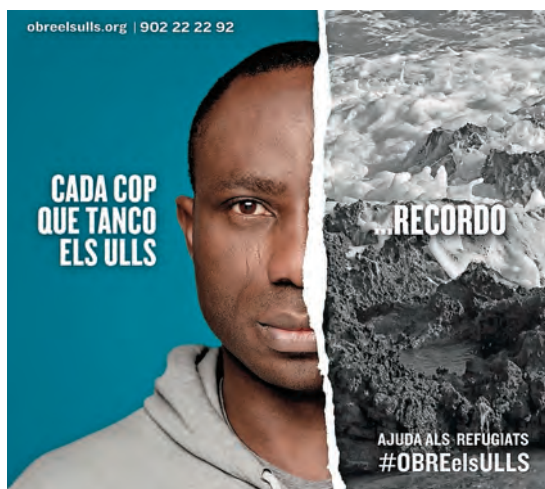
■ Cartell de la campanya #ObreElsUlls.