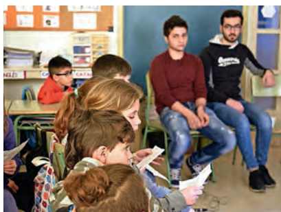
▶ Els infants de l'escola Alfred Mata de Puig-reig fan preguntes a dos joves refugiats.

Per preparar el taller d'avui, els alumnes han preparat i traduït, amb l'ajuda de la professora d'anglès, preguntes per plantejar als dos joves siris: "d'on són?, què feien al seu país d'origen?, per què van fugir?".