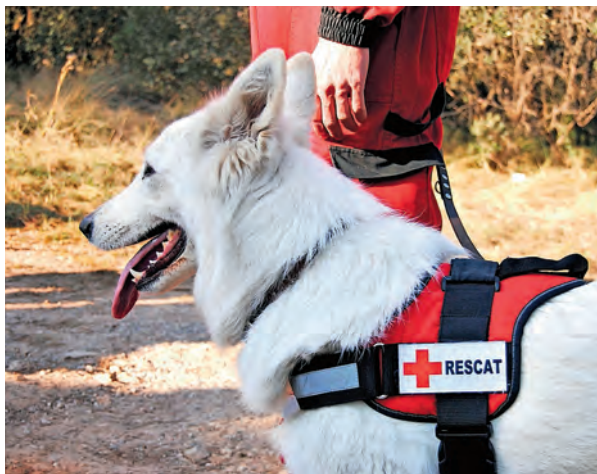
▶ Guia i gos de l'ERIE de Recerca i Rastreig amb Gossos.

en zones de risc (grans desnivells, coves...); i l'Equip de Sensibilització i Informació front Emergències (ESIE), especialitzat en atendre als infants i joves en situacions d'emergència. A més, és previst que abans de l'estiu la Creu Roja posi en marxa una Unitat Mòbil de Coordinació sobre terreny, vehicle equipat amb tota la tecnologia necessària per facilitar la tasca dels equips d'emergències.