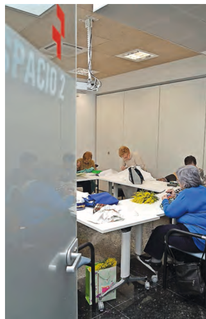
▶ Taller de costura en una de las aulas.

Espacio Activo triplica el espacio físico destinado a proyectos con personas mayores y su entorno, al pasar de 200 a 600 metros cuadrados, en planta baja y sin barreras arquitectónicas, ubicado en la calle de Aralar, número 2, de Pamplona.