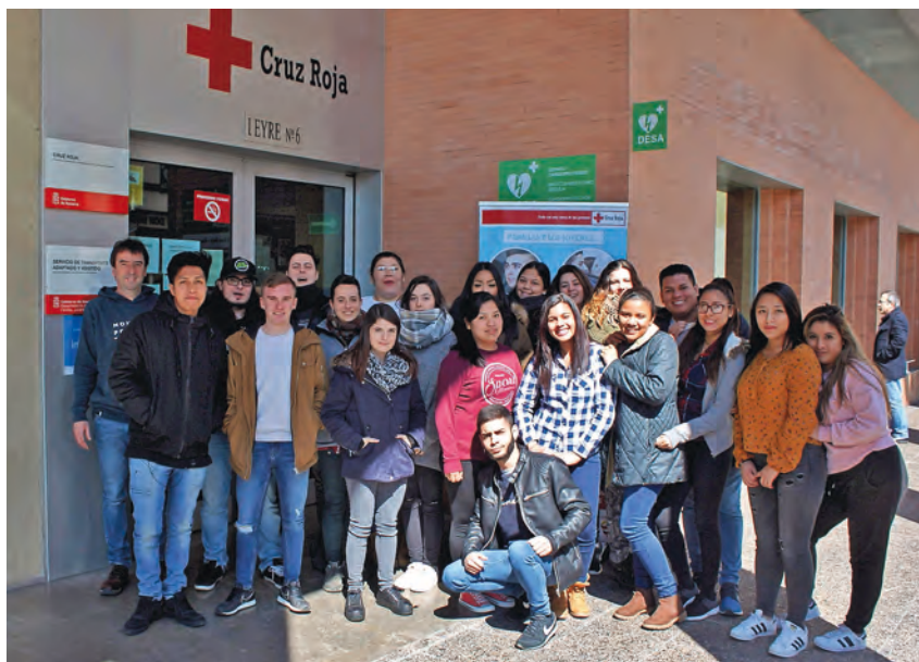
▶ Jóvenes participantes del Plan de Empleo de Cruz Roja Navarra.