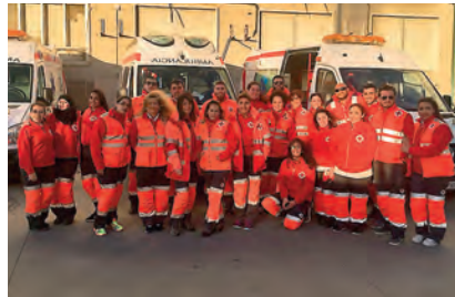
► Dispositivo sanitario preventivo durante la Cabalgata de Carnaval.