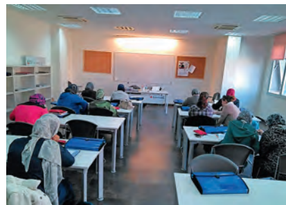
▶ Jóvenes en un aula de formación.

El objetivo de estos programas es la inserción sociolaboral y educativa de estos jóvenes, cuya situación personal y/o competencia lingüística dificulta su participación en otras enseñanzas regladas de FP impartidas en nuestra ciudad. En la actualidad, se desarrollan tres programas formativos con una duración de 900 horas cada uno que atienden a un total de 45 jóvenes. Los cursos incluyen un módulo de Formación en Centros de Trabajo, lo que les puede servir de puente y facilitar la incorporación al mundo laboral.