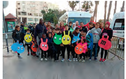
► Usuarios y usuarias del CETI el día de la Cabalgata, junto al voluntariado.