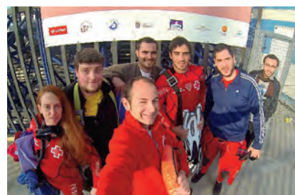
▶ Grupo de voluntariado de Medio Ambiente a punto de comenzar las prácticas en el taller Ballena Negra.