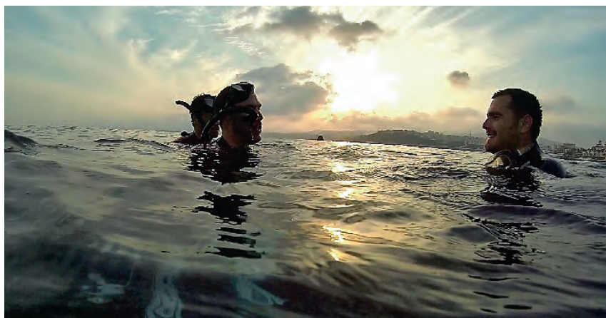
▶ Varios participantes en un paseo intermareal durante el taller de identificación de algas.