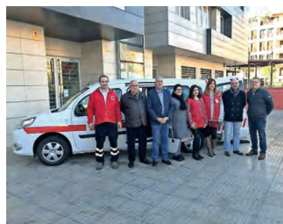
▶ Presentación del servicio de Teleasistencia en Melilla.

los servicios sanitarios ante cualquier incidencia. Además, gracias al servicio de Teleasistencia, se mitiga su sentimiento de soledad mediante llamadas periódicas, que pueden realizarse de forma más habitual en caso de que las circunstancias de vida que les rodean así lo requieran. En la actualidad, más de 600 mayores de nuestra ciudad se benefician de este servicio.