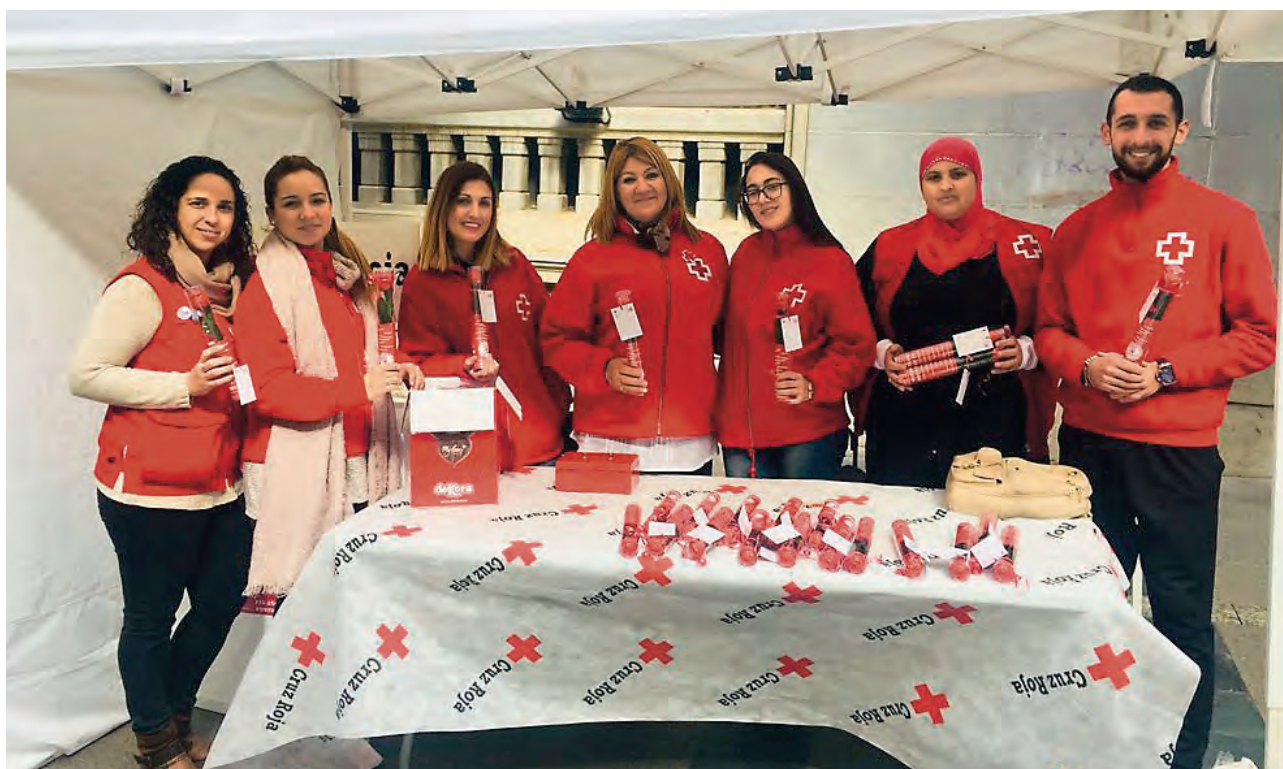
► Un grupo de Cupidos Voluntarios en uno de los stands de venta de las rosas solidarias.

Los Cupidos Voluntarios repartieron 3.000 rosas solidarias entre los residentes en la ciudad. Cerca de 80 personas colaboraron en una campaña que concluyó con enorme éxito.