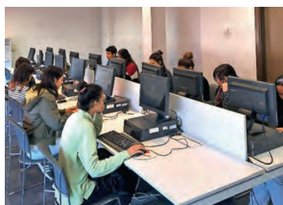
▶ La formación es la base de la integración.