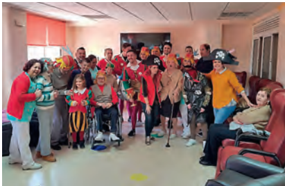
► El Centro de Alzheimer celebra los carnavales.

tes en el CETI habían elaborado durante los días previos, junto al voluntariado de Cruz Roja en dicho centro, los disfraces que tanto los mayores como los pequeños pudieron lucir en la Cabalgata. Tampoco el personal del Centro de Día para Enfermos de Alzheimer se quedó atrás durante las fiestas, en las que prepararon un chocolate con churros para el voluntariado, los equipos técnicos y para todos los usuarios y usuarias. Además, recibieron la visita de una chirigota.