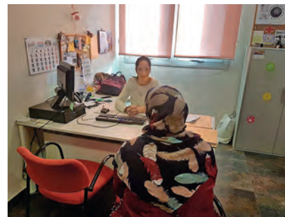
► Para las mujeres, es clave ser escuchadas.

mentales de las mujeres, en particular de su derecho a la vida, la libertad, la igualdad, la dignidad y a la seguridad. En este contexto se puso en marcha el actual Servicio Telefónico de Atención y Protección para Víctimas de la Violencia de Género (ATENPRO) , cuya titularidad pertenece al Ministerio de Sanidad, Servicios Sociales e Igualdad y gestiona la Federación Española de Municipios y Provincias (FEMP). Es una modalidad que, con la tecnología adecuada, ofrece a estas víctimas una atención inmediata y a distancia, con un centro atendido por personal específicamente preparado. De esta manera se asegura una respuesta rápida a la eventualidad que les pueda sobrevenir, bien por sí mismo o mediante la movilización de otros recursos humanos y materiales, propios de la usuaria o existentes en la comunidad, las 24 horas del día, los 365 del año y sea cual sea la situación en que se encuentren.