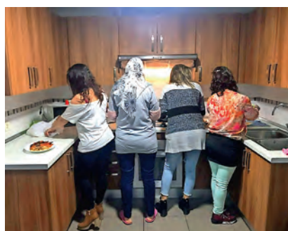
► Talleres de cocina saludable.

Uno de los recursos fundamentales es la casa de acogida, para aquellos casos en los que se precise llevar a cabo medidas de protección y/o urgencia para las mujeres