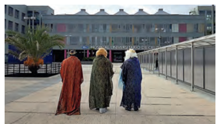
► Sus Majestades llegan al Hospital Universitario para visitar la Ludoteca de Cruz Roja Juventud.

nar de magia e ilusión a estas personas, quienes pudieron fotografiarse con ellos y revivir la magia de esta festividad.