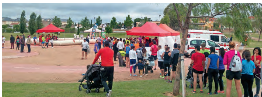
▶ Participantes en la I Carrera Contra el Acoso Escolar.

Un total de 400 personas participaron en este evento en Badajoz.