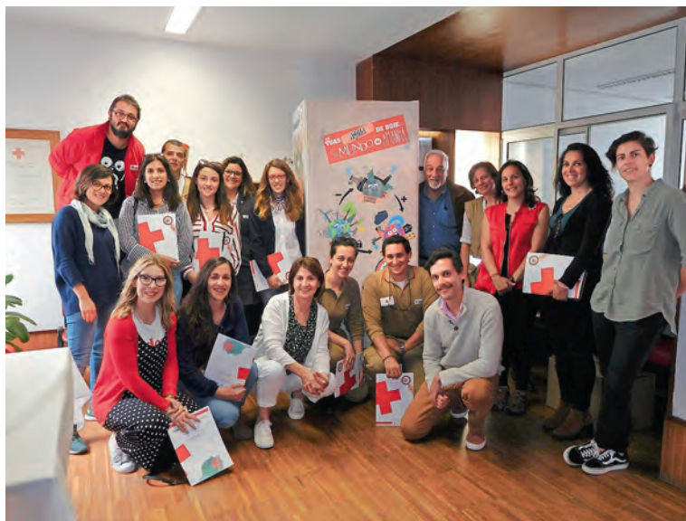
◆ Agentes medioambientales dinamizan la exposición itinerante de medio ambiente en ambas regiones extremeñas y alentejanas.