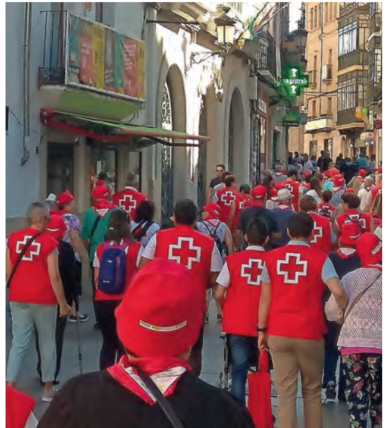
▶ Voluntarios y personas mayores durante el día de convivencia por la calles de Cáceres.

A través de los diferentes proyectos, Cruz Roja pretende identificar y prevenir algunos factores de riesgo que pueden desembocar durante la vejez. Y así, ayudar a estas personas a poner en marcha las acciones necesarias para protegerse frente a esos problemas y a disfrutar de una mayor calidad de vida. Por otro lado, la participación del voluntariado es clave en el éxito de cada uno de los programas y constituye el soporte mayoritario. La persona voluntaria es fuente de escucha, nexo de apoyo y referente comunitario de la intervención desarrollada por Cruz Roja. En la actualidad, en la comunidad extremeña un total de 1.400 personas voluntarias participan en los proyectos dirigidos a personas mayores.