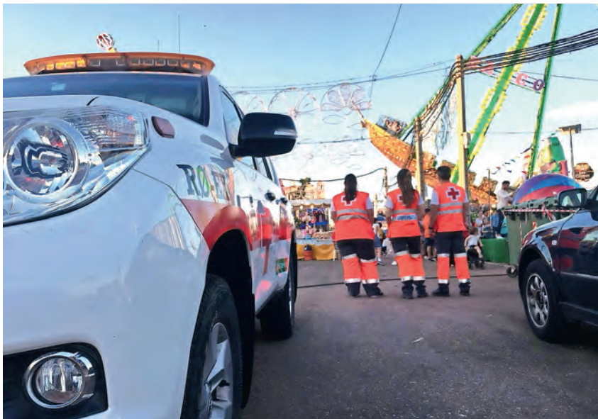
▶ El voluntariado de Cruz Roja en las ferias y fiestas de nuestros pueblos.

En 2018, la Institución ha puesto en marcha en Extremadura alrededor de 1.200 coberturas de riesgo previsible, y algo más de 700 de ellas se han desarrollado durante el periodo estival.