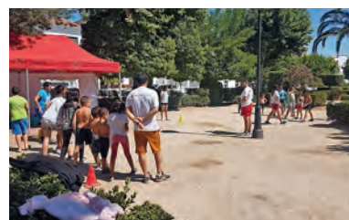
▶ Voluntarios de Cruz Roja y menores durante las actividades de verano.

Durante este verano, Cruz Roja Juventud Cáceres ha llevado a cabo actividades de ocio en espacios abiertos, para que todos los menores que quisieran acercarse disfrutaran de momentos llenos de diversión. También realizaron actividades de sensibilización e información con menores para prevenir actitudes de rechazo y estigmatización hacia personas de diferentes culturas. Asimismo, se completaron actividades de sensibilización del Medio Ambiente con los más pequeños, a través de la limpieza del entorno y clasificación de la basura que recogían.