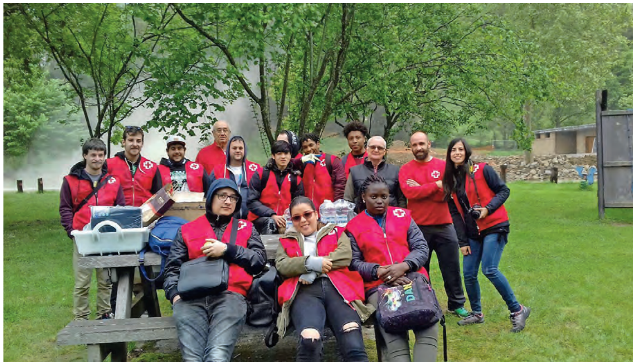
► Intervención de voluntarios y voluntarias de Cruz Roja en el río Asón.

La Organización se suma a la lucha contra la pobreza energética y ayuda a 132 familias necesitadas.