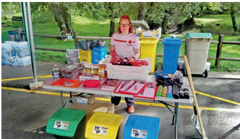
► Una de las acciones de vigilancia ambiental y reciclaje.

En el caso de los niños se incrementan las posibilidades de sufrir problemas respiratorios o enfermedades como catarros y gripes, con un aumento en la frecuencia y duración de los episodios. También tienen menor ganancia de peso y mayor nivel de ingresos hospitalarios en la primera infancia.