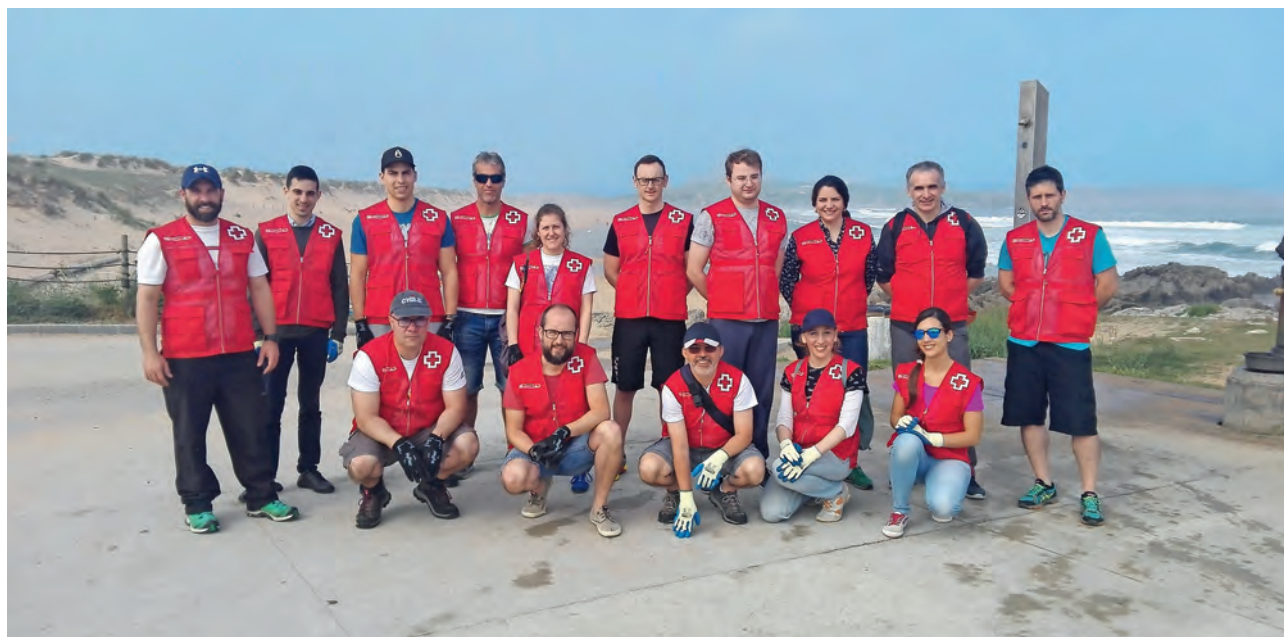
► Vigilancia ambiental en playas con la colaboración del personal de la empresa INGRAM.

la emisión de gases de efecto invernadero, a la lucha contra la pobreza energética de los colectivos vulnerables y ayudaremos a muchos hogares a hacer frente al pago de sus suministros de energía.