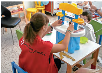
► Una voluntaria de Infancia Hospitalaria

Casi un tercio de los proyectos sociales de la Organización financiados con la 'X solidaria' están destinados a mejorar la calidad de vida de niños y niñas.