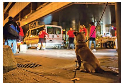
► Voluntariado atiende a personas en las calles de Córdoba.

veces es apenas necesaria una mano afable. Ocurrió con un señor al que nuestro voluntariado ayudaba en el entorno de un centro comercial de Málaga. A través de un reportaje para televisión, un amigo suyo de Alicante le reconoció y contactó con Cruz Roja para ofrecerle una oportunidad laboral. Un rayo de esperanza para quienes ya la habían perdido.