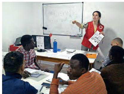
▶ Sesiones de español.

Cruz Roja Española ofrece orientación a personas inmigrantes, además de intervenir en asentamientos en los que se sufre una exclusión extrema.