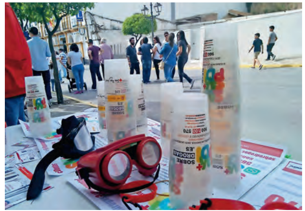
► Estand informativo de Cruz Roja Juventud.