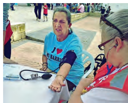
▶ El objetivo del proyecto es mejorar las condiciones del entorno.

El objetivo, además de reducir las necesidades de quienes viven en estos barrios, busca mejorar las condiciones del entorno: aspectos medioambientales, el acceso a la cultura, la igualdad de oportunidades, coeducación, y orientación laboral, etc.