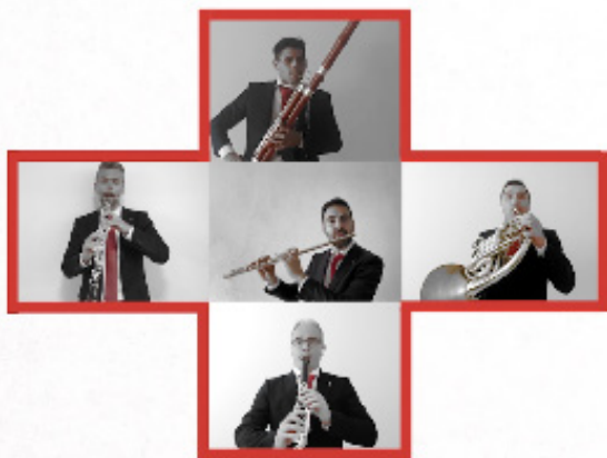
Quinteto de viento de La Pamplonesa que interpreta el vals de Astráin.