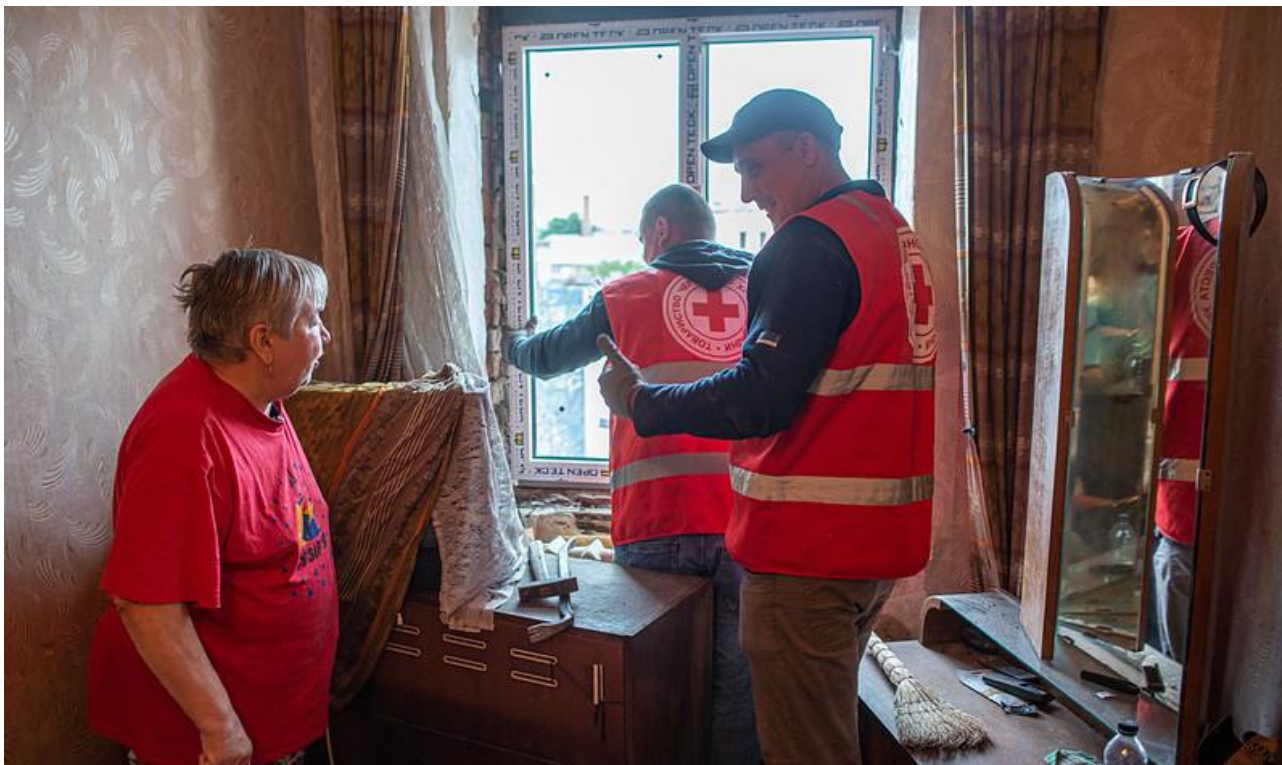
Voluntarios protegiendo viviendas afectadas de personas vulnerables.

Para el desarrollo de todas estas actividades, Cruz Roja Ucraniana cuenta con 200 oficinas locales (de las que 21 han sido dañadas como consecuencia de los enfrentamientos) y 8.000 personas voluntarias.