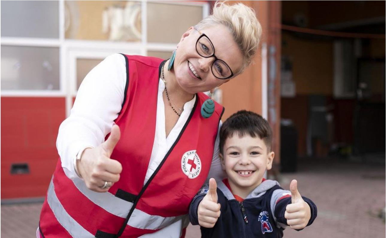
@Cruz Roja Polaca_Voluntaria en Lubartów en espacio amigable "Dream Factory"

especializados; restablecimiento del contacto entre familiares y estableciendo proyectos de apoyo para su inclusión socio-laboral en las comunidades locales.