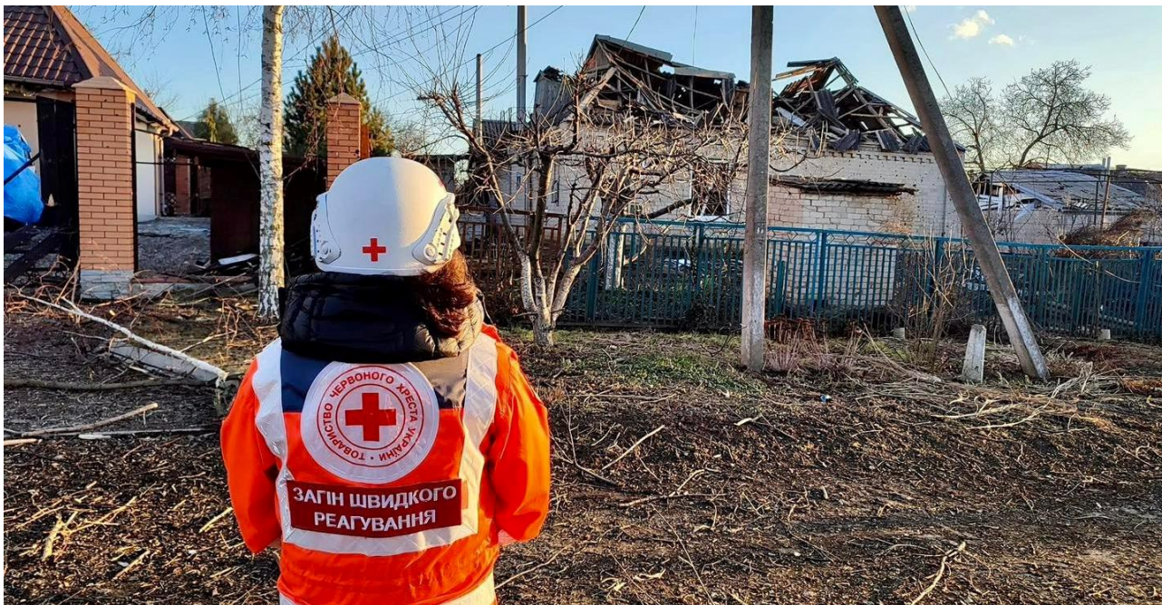
@Cruz Roja Ucrainiana_ Equipo de respuesta en emergencias en Zaporizhzhia

La Cruz Roja Ucraniana está llevando a cabo intervenciones prioritarias en las zonas directamente afectadas por las hostilidades: