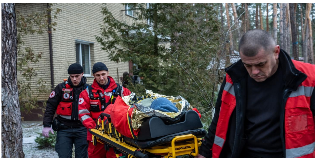
Equipo de respuesta en emergencias realizando una evacuación

El conflicto en Ucrania ha afectado significativamente el acceso de la población a medios de subsistencia y la atención sanitaria , empeorando la gravedad de las condiciones humanitarias en el país. Los daños en la agricultura y las pérdidas en producción siguen aumentando , causando una grave crisis sobre la población rural. Esta situación está provocando unas consecuencias económicas catastróficas en todo el país, debido a la falta de empleo, el descenso de los ingresos y la elevada inflación.