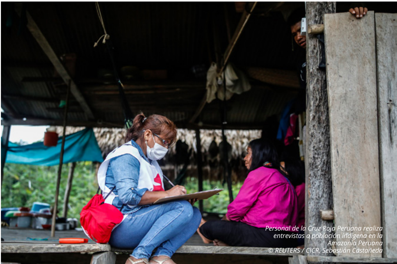
Personal de la Cruz Roja Peruana realiza entrevistas a población indígena en la Amazonía Peruana