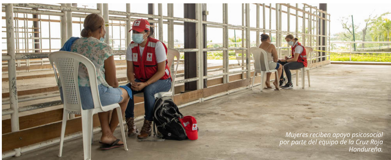
Mujeres reciben apoyo psicosocial por parte del equipo de la Cruz Roja Hondureña.

El seguimiento se debe realizar en tiempos adecuados, que permitan identificar aquellos aspectos de PGI que se puedan afectar negativamente o generen condiciones de mayor vulnerabilidad, de tal forma se implementen medidas de mitigación y corrección en las actividades.