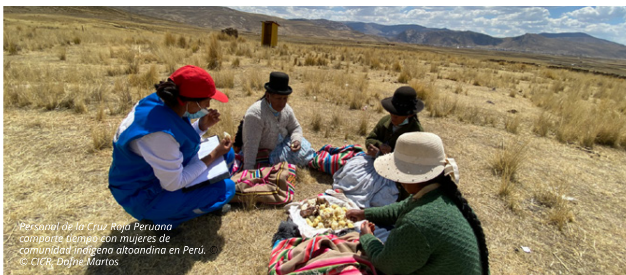
Personal de la Cruz Roja Peruana comparte tiempo con mujeres de comunidad indígena altoandina en Perú.

Para profundizar en las herramientas de mercados se recomienda revisar la Caja de herramientas de PTM de Cash-hub y la Caja de herramientas de MdV del Centro de Recursos de MdV . Pueden también seguir un curso autoguiado de Evaluación Rápida de Mercados (RAM) .