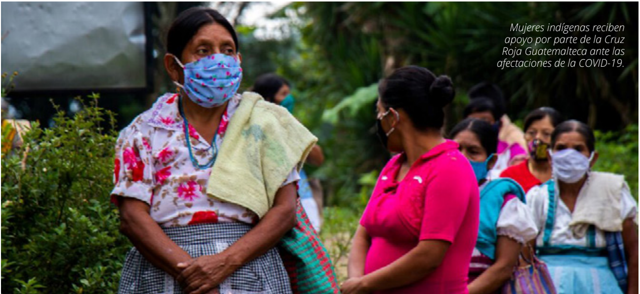
Mujeres indígenas reciben apoyo por parte de la Cruz Roja Guatemalteca ante las afectaciones de la COVID-19.

El enfoque de PGI aborda las situaciones de desigualdad que generan las crisis y analiza qué poblaciones o sectores se ven especialmente afectados en función de su edad, género, discapacidad, etnia, estatus migratorio y otras características de diversidad.